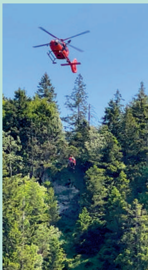
▲一架救援直升機盤旋在深谷上方。