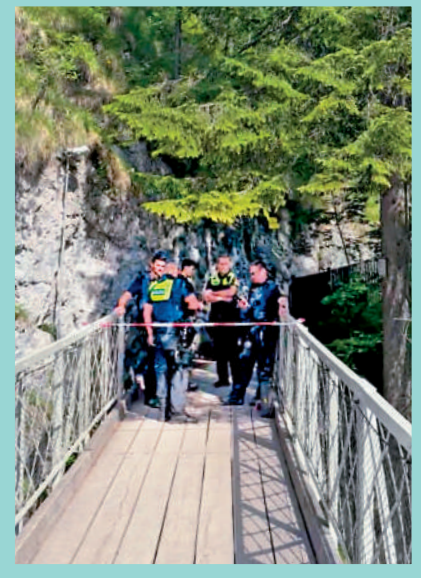
▲案發環境地勢極為險峻。