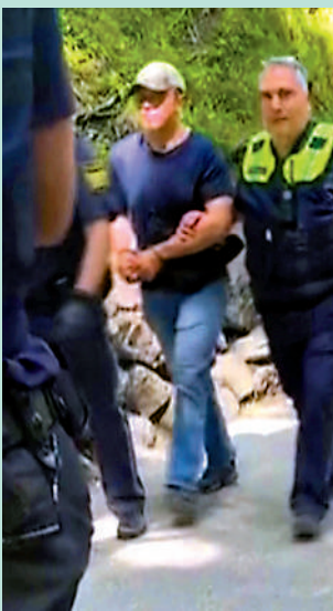
▲視頻截取的圖片顯示，警方14日逮捕了行兇的美籍男子。

痛失愛子的父親同時怒斥管理機構，認為當地政府根本沒有做好海域管控，「這邊又不是什麼野生海岸，或是無管理的水域！」埃及政府在命案發生後，隨即下令關閉從北至南大片紅海海灘，禁止民眾下水游玩。據悉，紅海沿岸地區很少發生鯊魚襲擊事件。不過，虎鯊是國際鯊魚攻擊檔案中引用最多的無端攻擊人類的鯊魚之一。