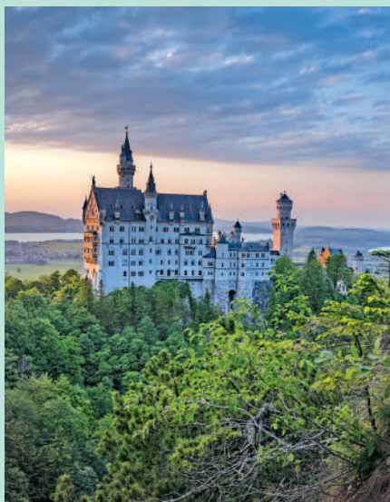
▲德國新天鵝堡是最受歡迎的旅遊景點之一。