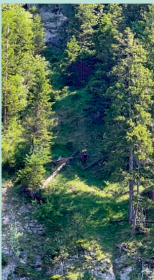
▲救援人員在深谷尋找兩名遇害女遊客。