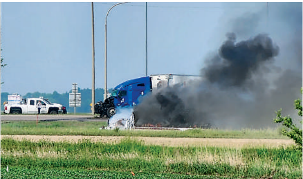
▲加拿大車禍現場有濃煙冒出。