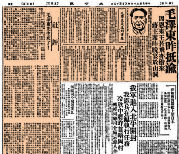
▲1945年8月29日，《大公報》在要聞版刊登了毛澤東抵渝的消息，並在頭條位置破例刊登了一幅自製的毛澤東木刻頭像。而時任《大公報》總編輯王芸生則寫了社論《毛澤東先生來了！》。

這些題詞各有藝術風采，隨時光流轉，歷史文化積澱日益厚重，也在《大公報》120多年的歷史中鑄刻下一道獨特的珍貴印記，激勵一代代報人薪火相傳，與人民同呼吸、共命運。