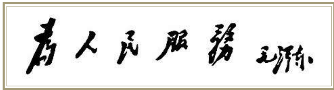
▲1945年9月20日晚，毛澤東為《大公報》題寫「為人民服務」五個大字。

毛澤東的相關題詞中，且均是在延安所題寫。1944年7月，著名新聞記者、出版家鄒韜奮在上海病逝。同年11月15日，毛澤東在延安題寫輓詞：「熱愛人民，真誠地為人民服務，鞠躬盡瘁，死而後已，這就是鄒韜奮先生的精神，這就是他之所以感動人的地方。」