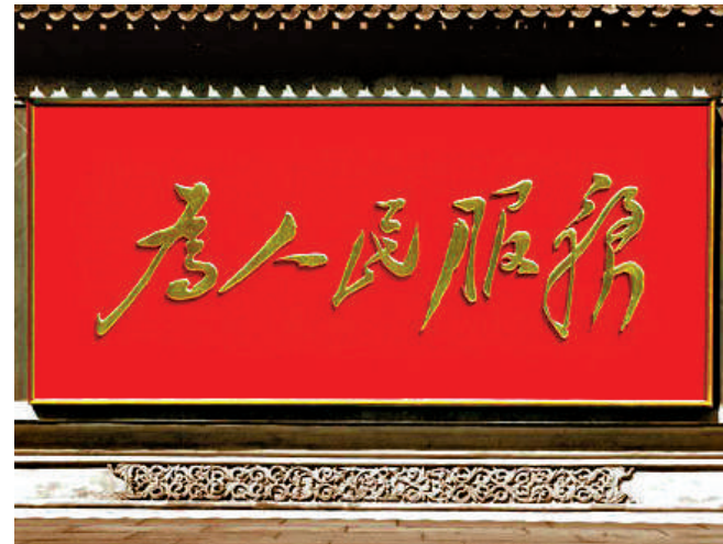
▲中南海新華門影壁上的「為人民服務」。