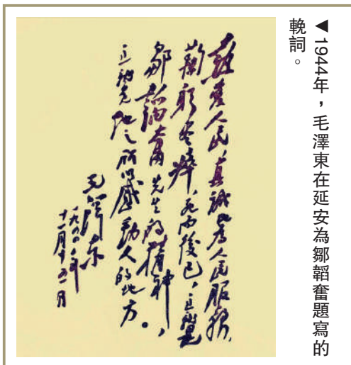
▲1944年，毛澤東在延安為鄒韜奮題寫的題詞。

1945年4月23日，毛澤東在中共七大開幕詞中告誡全黨：「我們應該謙虛，謹慎，戒驕，戒躁，全心全意地為中國人民服務。」七大正式將「為人民服務」寫進黨章。