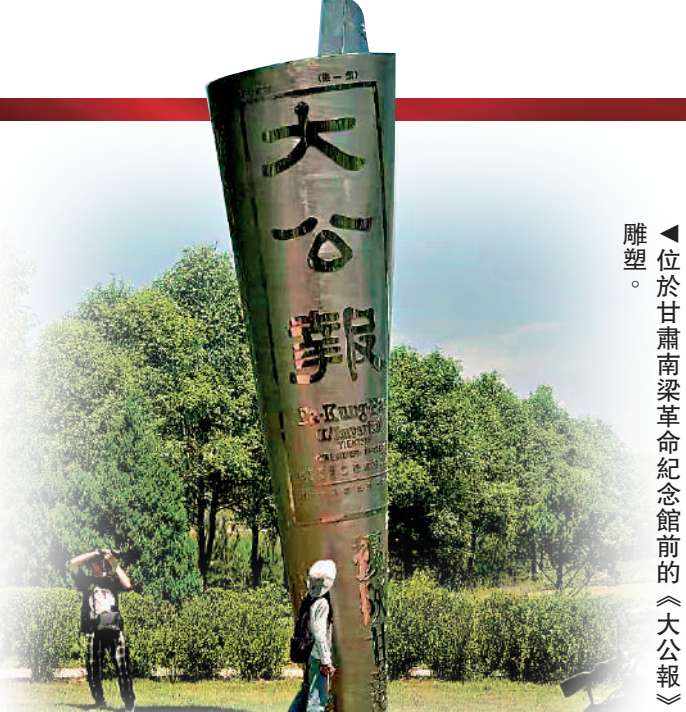
▲位於甘肅南梁革命紀念館前的《大公報》雕塑。