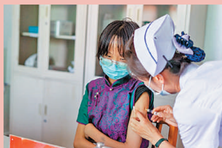
▲一名內蒙古鄂爾多斯適齡女性正在接種免費宮頸癌疫苗。

● 基金會在非洲國家開展瘧疾防控示範項目，在中國經驗和模式的基礎上，探索適宜當地的瘧疾防控策略，以加速實現全球消除瘧疾的目標。