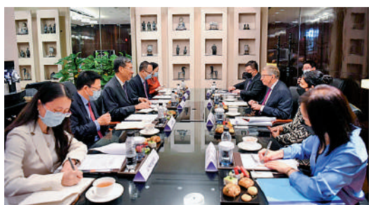
▲15日上午，財政部部長劉昆與美國比爾及梅琳達·蓋茨基金會聯席主席比爾·蓋茨舉行工作早餐會。

蓋茨表示，在各方共同努力下，全球健康藥物研發中心成立五年來取得了重要進展，感謝北京市政府對研發中心的大力支持。蓋茨基金會願與北京市等夥伴一道，共同加大投入，推動中心的研發突破，最終讓更多創新成果惠及世界，促進全球健康公平的實現。北京市政府秘書長穆鵬參加。