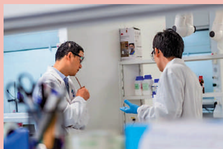
▲科學家在全世界健康藥物研發中心工作。