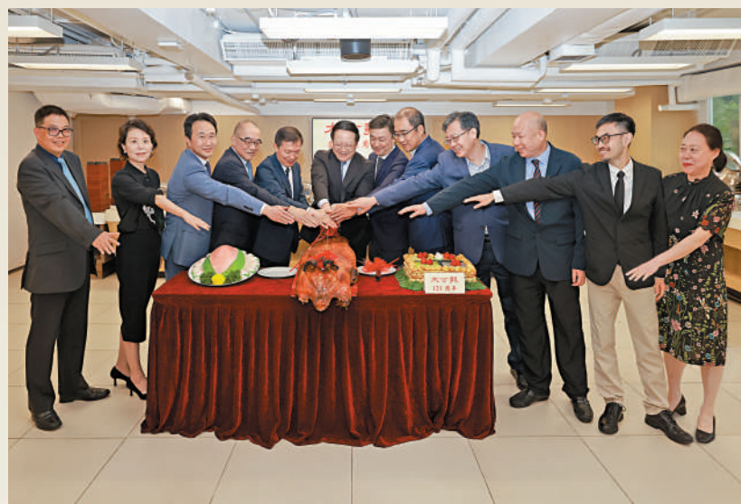
▲今日是《大公報》121歲生日，昨日舉行了簡單而隆重的慶祝儀式。

《大公報》1902年6月17日於天津創刊，是中國迄今歷史最悠久的報紙，也是全世界連續出版時間最長的華文報紙，近年積極發展網絡傳播。「忘己之為大，無私之謂公」是《大公報》的辦報宗旨。「立言為公、文章報國」，是《大公報》創刊至今的堅持。一年前的6月12日，在香港即將迎來回歸祖國25周年之際，習近平總書記親致賀信，祝賀《大公報》創刊120周年，對《大公報》工作給予高度肯定，並提出殷切期望，希望《大公報》不忘初心，弘揚愛國傳統，銳意創新發展，不斷擴大傳播力和影響力，為「一國兩制」實踐行穩致遠、為實現中華民族偉大復興的中國夢書寫更為精彩的時代篇章。一年來，香港大公文匯傳媒集團牢記習近平總書記的囑託，以賀信精神為指引，不斷提升在香港、內地、海外三地的影響力和美譽度。