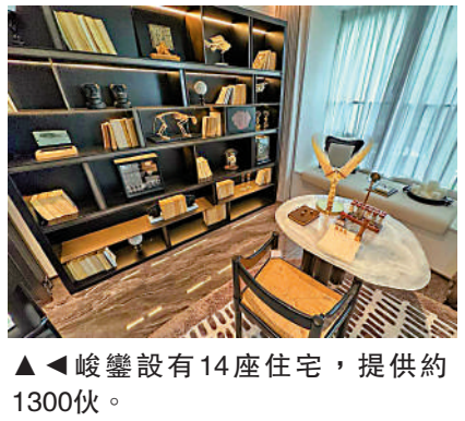
▲峻鑾設有14座住宅，提供約1300伙。