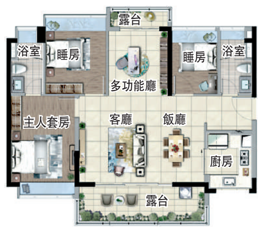
▲時代天韻110平米三房三廳戶型圖。