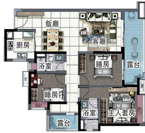
▲保利翔龍天匯122平米三房兩廳戶型圖。