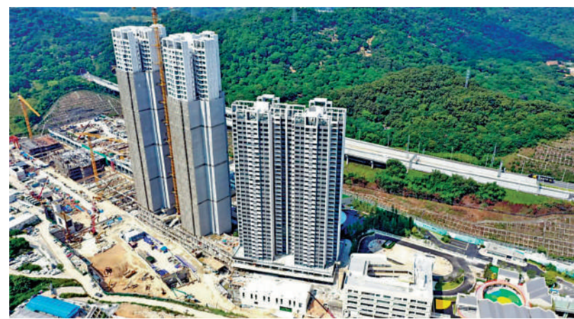
▲星樾山畔共9幢超高层住宅，將分階段落成。