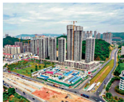
▲時代天韻佔地達10萬平米。