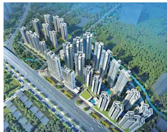
▲保利翔龍天匯規劃共16幢住宅，提供3100伙。