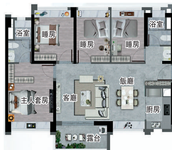
▲星樾山畔110平米四房兩廳戶型圖。