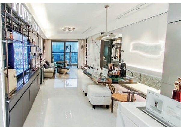
▲保利翔龍天匯間隔由兩房兩廳至四房兩廳。

校網方面，項目周邊有科學城小學、黃陂小學及廣州市第一一七中學。屋苑附近有自然山景、森林公園、濕地公園等，小區綠化率35%，生態環境不錯。