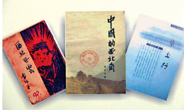
▲《中國的西北角》出版，讀者爭相搶購，一時洛陽紙貴。

為了向人們詳細介紹西北的交通狀況，《大公報》特派記者李天織到了綏遠，於1933年8月下旬，借綏新公路試通車之機，搭車去新疆。一路艱險，計程一個半月抵達新疆迪化。當他從新疆返回時，途中遭遇戰事，交通中斷，被新疆督辦扣押，嘗盡幽禁之苦。以至他將事實見聞寫成《新疆旅行記》時，深感「有萬語千言無從說起之憾」。同年四月的《西康情況》調查記，也是記者經若干時日的艱辛跋涉，而窺得地處邊陲、交通困難的西康實情。《大公報》總編輯兼主筆張季鸞，還親自兩次