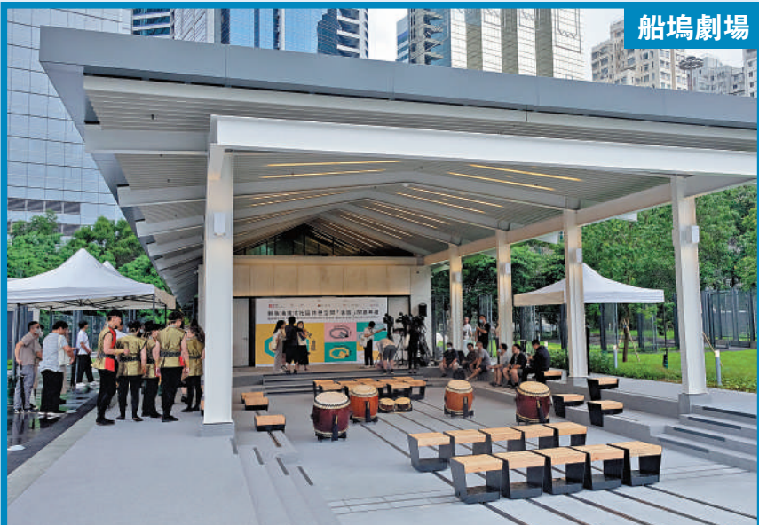
▲24小時開放的半露天展演空間「船塢劇場」採用下沉階梯式設計，讓公眾可以坐在台階欣賞不同類型的表演。

聖雅各福群會表示，不少街坊希望在該區有更多休憩空間，部分團體亦希望在社區有更多場所舉辦活動，故在了解發展局的資助計劃後，便作出申請，希望善用土地，為社區作出貢獻。