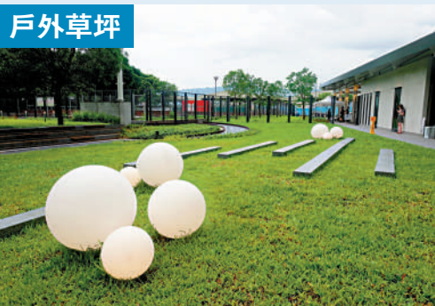
▲戶外開放式草坪為市民、動物愛好者和「毛孩」在鬧市提供綠色活動休憩空間。