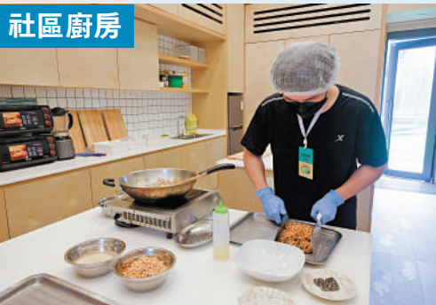
▲「社區廚房」會舉辦烹飪班和特色小食工作坊等，透過飲食文化連結社區。