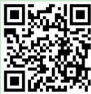
「黑夜尋寶」導賞團報名表格

為讓市民感受晚間的生態特色，由港燈與長春社合辦的「綠遊香港」，將復辦疫後首個「黑夜尋寶」實體導賞團，為免遊客過多打擾生態，只在7月8日舉辦兩團，名額共30人，有興趣的市民可到網上報名（ www.cahk.org.hk/greenhkgreen ）。