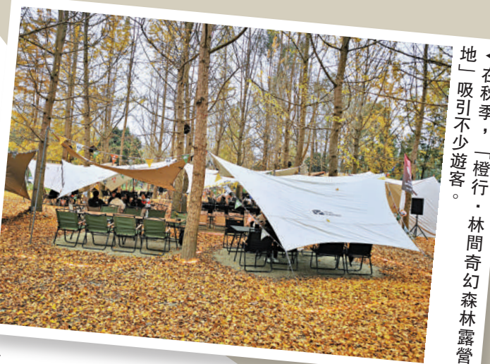
▲在秋季，「橙行·林間奇幻森林露營地」吸引不少遊客。