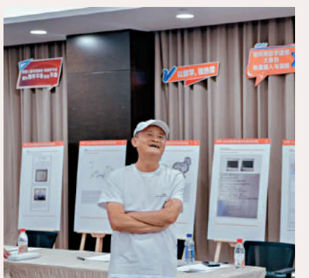
▲馬雲回到杭州的賽事現場了解決賽情況。

的理解。馬雲表示，明年大賽還會不斷創新，給熱愛數學的人們帶來新的樂趣。 馬雲在2018年發起創辦阿里巴巴全球數學競賽，希望通過有趣的競賽激發人們對數學的熱愛，與社會各界共同推動數學基礎學科。 今次決賽分五個數學賽道，在預賽階段，已吸引逾5萬人參加，有學生、律師、銷售員、文物修復師、程序员、快遞員，其中近半是女選手，年齡最大的為67歲。