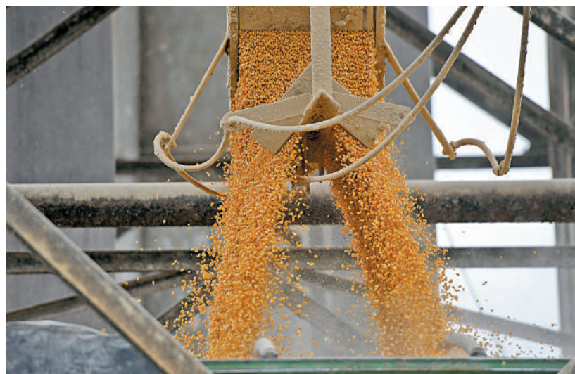
▲中國與巴西早前達成以本幣(人民幣與雷亞爾)進行貿易與投資結算協議，中國從巴西進口大豆與玉米等農產品，以人民幣結算只是時間問題。

事實上，人民幣在國際社會受性不斷提升，愈來愈多國家使用人民幣作為交易結算。例如中國與巴西早前達成以本幣（人民幣與雷亞爾）進行貿易與投資結算協議。換言之，中國從巴西進口大豆與玉米產品等農產品，以人民幣結算只是時間問題，而阿根廷更在今年4月至5月開始使用人民幣貿易結算，從中國進口商品金額中，便有19%以人民幣結算。因此，今年人民幣在內地跨境收付佔比有望突破五成，可視為人民幣國際化進程的重要里程碑。