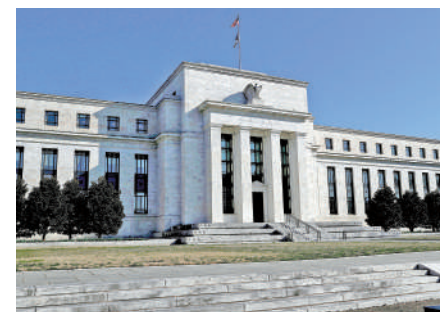
▲市場觀望聯儲局主席鮑威爾會否繼續發表鷹派言論。