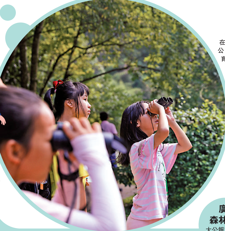
▲灣區青少年在節假日走進森林公園，體驗自然教育。