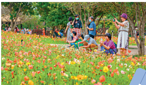
▲廣東森林公園的花海吸引不少遊客前來觀光。

位於東莞樟木頭的廣東觀音山國家森林公園，坐擁東莞市內最大最完整的原始次生林，是國家4A級旅遊風景區，被譽為「南天靈秀勝境，森林康養福地」。廣東省林業局有關負責人表示，森林旅遊作為融合休閒、醫養等功能的綠色綜合型產業，在推動林業產業優化升級、拉動區域經濟發展方面具有重要作用。廣東常住人口有1.27億人，粵港澳大灣區「9+2」城市人口規模已經超過8600萬人，發展森林旅遊等林業第三產業市場前景廣闊。