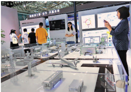
▲博覽會上，寧德時代展出最新的新能源應用產品。

上海胡潤百富投資管理諮詢有限公司董事長胡潤現場發布《2023胡潤中國新能源產業集聚度城市榜》，常州位居第4位，比去年上升1位，新能