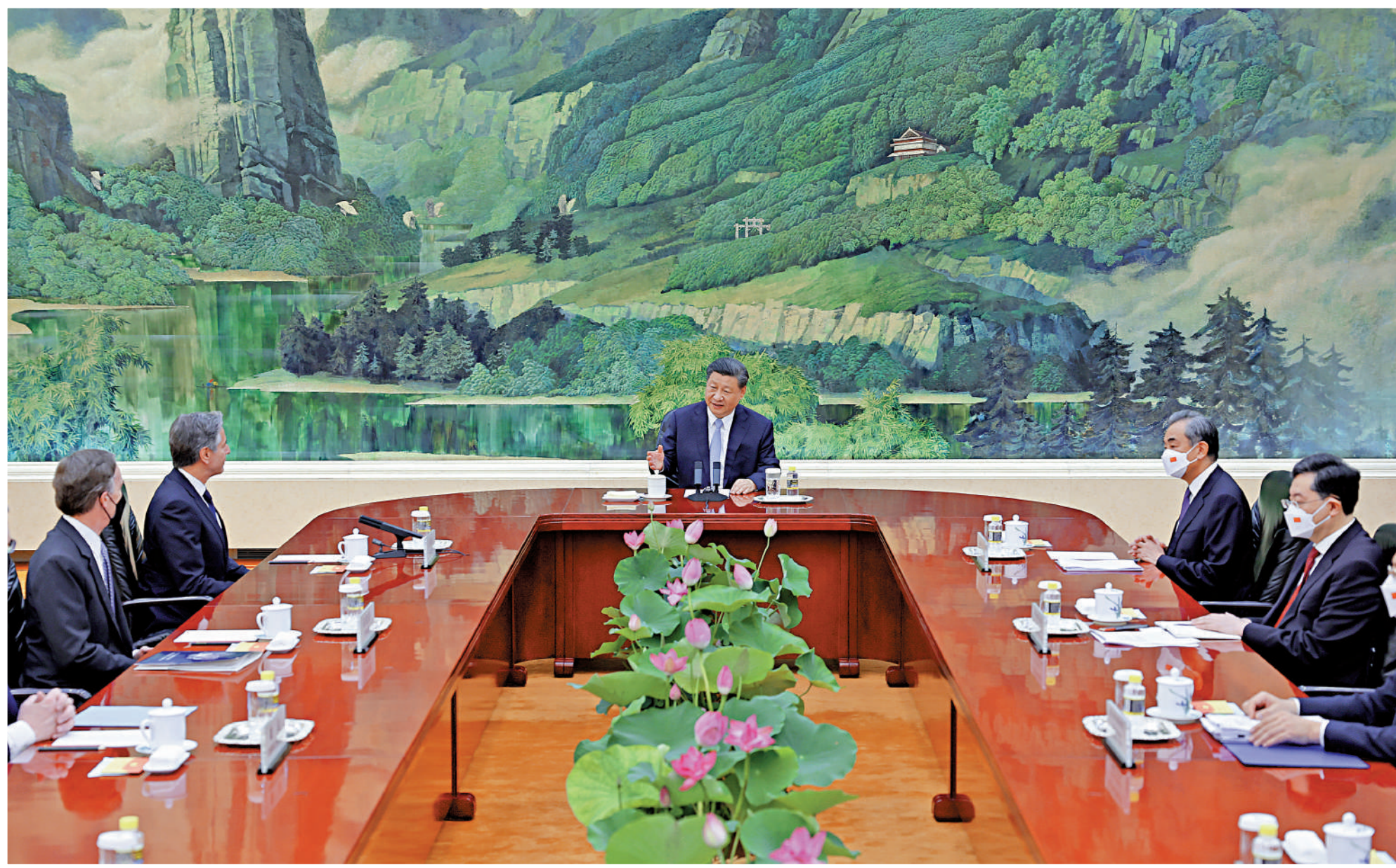
◀6月19日下午，中國國家主席習近平在人民大會堂會見來訪的美國國務卿布林肯。會見現場，擺放在會見桌中央盛開的荷花十分引人注目。當下正是荷花盛開時節，「荷」與「和」「合」諧音，期待中美兩國和平共處、合作共贏。