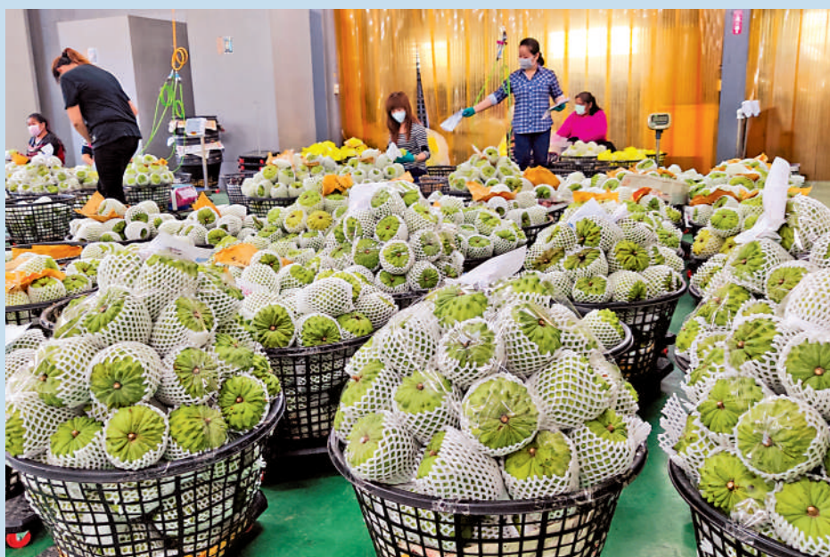
▲大陸恢復輸入台灣番荔枝,島內農民紛紛讚好。資料圖片

【大公報訊】綜合新華社、中通社及台媒報道:國務院台辦發言人朱鳳蓮20日表示,在綜合評估相關整改措施的基礎上,海關總署決定自6月20日起恢復台灣地區番荔枝(台灣地區稱釋迦)輸入,輸大陸番荔枝須來自獲得註冊登記的包裝廠和果園。島內輿論指出,大陸方面再次釋出善意,積極回應台灣業界的訴求,也是近月兩岸交流的重要成果。台灣農民感謝國民黨的協助以及大陸方面的善意,希望今年的釋迦能賣出好價錢。