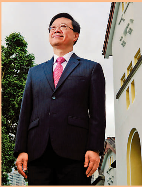
▲行政長官李家超表示，香港在四大科研範疇具優勢，即生物科技、人工智能、智慧城市及金融科技，香港創科大有可為。