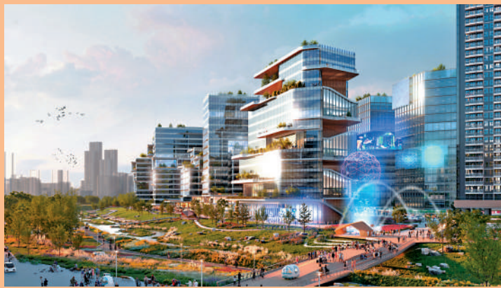
▲新田科技城由「創新科技園區」和「新田市中心」組成，將成為創科發展集群的樞紐，與深圳產生協同效應。 模擬圖片