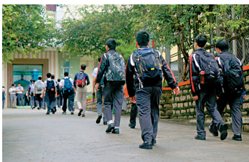
▲教育局於2023/24學年起，推行2500元學生津貼電子申請。

教育局提醒，家長須於學校活動前，在其個人流動電話啟用生物認證功能，如指紋或臉容辨識等，以及安裝「智方便」流動應用程式。此外，家長於現場登記時，須同時備妥香港身份證、個人流動電話、一個可接收電子郵件的電郵地址。至於未能遞交電子申請的家長，仍可將填妥的紙本申請表格交回學校辦理。