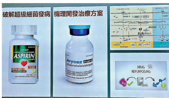
▲阿士匹靈（左）配合其他抗生素，對於急性肺炎克雷伯菌感染十分有效。