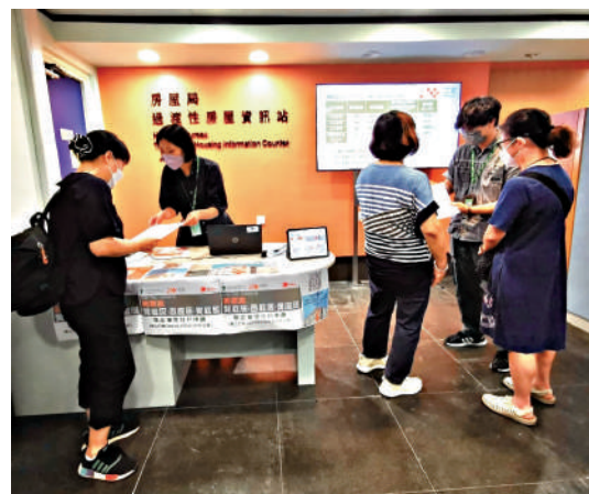
▲過渡性房屋資訊站派發及收集中央通用申請表格，方便市民一站式地申請不同過渡性房屋項目。

房屋局表示，過渡性房屋至今已約7000個單位投入服務。新的中央通用申請表透過專題網頁、各過渡性房屋營運機構、設於房屋委員會會務中心的過渡性房屋資訊站、房屋署現金津貼辦事處等渠道派發和收集。