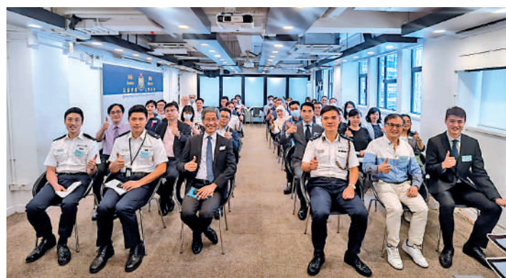
▲東區警區昨日舉行國家安全教育講座暨東區警區青少年防罪座談會。

東區警區期望，通過與教育界深入交流青少年犯罪心理，以及推廣警方舉辦的青少年防罪活動，共同推動學生建立正向生活，以免他們墮入法網。