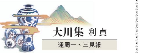
大川集 利貞 逢周一、三見報

而我的關注重點則在這位楊老師身上，因為視頻中並沒有寫楊老師的身份，我只能在軍博官方賬號的其他視頻中尋找，但其他視頻最多也只註明了「講解嘉賓 楊南鎮」幾個字。雖然身份沒有寫，但好歹有了名字，我就將「楊南鎮」三個大字輸入搜索引擎，結果——不查不知道，一查嚇一跳：楊南鎮，海軍大校，兩棲戰專家、海軍學術研究所研究員、中國海軍陸戰隊創始人之一，曾任中國海軍陸戰隊的首任旅長。眼前娓娓道來，對各種武器如數家珍的楊老師，居然是這樣一位理論與實踐結合的大神，果然是「國」字號博物館請來的嘉賓呀！