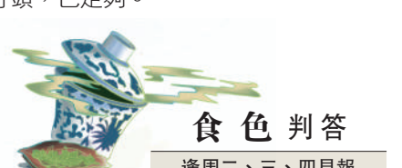
食色判答 逢周二、三、四見報