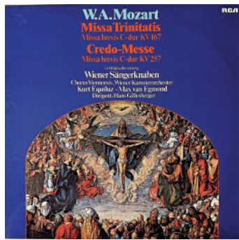
藝加之言 王加 微信公眾號：Jia_artscolumn 逢周三見報