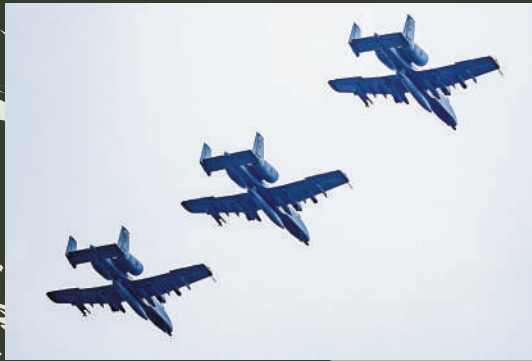
▲美軍A-10戰鬥機16日在德國參加北約軍演。

《經濟學人》21日刊登對英國國防大臣華萊士的專訪。華萊士稱，他預計自己無法接替斯托爾滕貝格出任北約秘書長，因為美國希望斯托爾滕貝格留任。