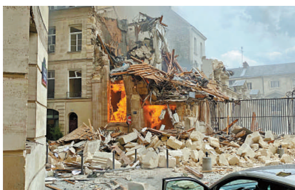
▲巴黎一棟建築21日發生爆炸，造成約50人受傷。

當地時間21日下午5時左右，位於巴黎五區的巴黎美國學院二樓發生爆炸，引發大火，該建築主體被破壞並倒塌。270名消防員和70輛消防車參加了滅火和救援行動。截至當日晚間，大火已被撲滅。巴黎檢察院22日說，事故共造成約50人受傷，其中6人情況危殆，另有1人失蹤，救援人員在廢墟中繼續搜救。法媒早前報道稱，共有2人在爆炸中失蹤，後來證實其中一人已被送進