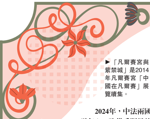
「凡爾賽宮與紫禁城」是2014年凡爾賽宮「中國在凡爾賽」展覽續集。