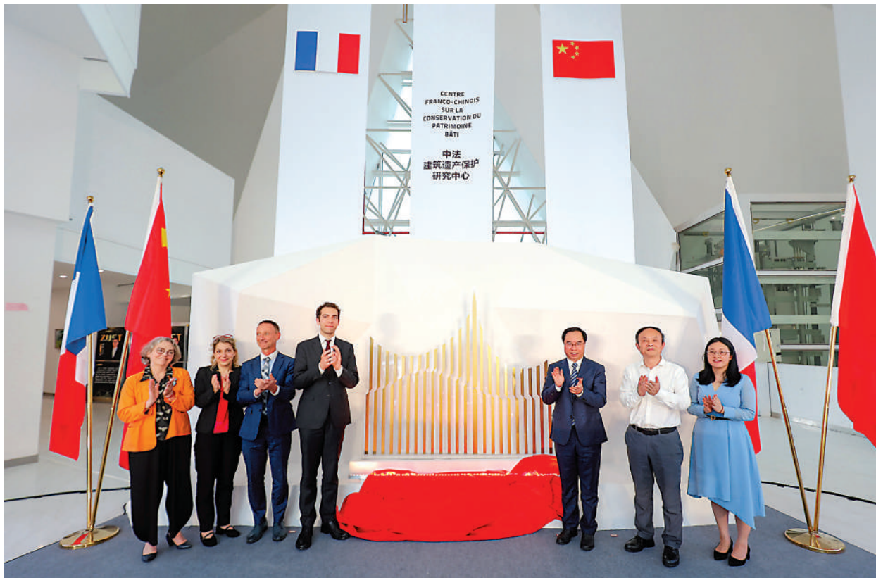
▲5月26日，中法合作共建中法建築遺產保護研究中心的意向書在杭州聯合簽署，裴國良（左四）出席儀式。

2024年，中法兩國即將迎來建交60周年以及「中法文化旅遊年」，除備受矚目的「凡爾賽宮與紫禁城」展覽和每年一度的文化重頭戲「中法文化之春」外，中法兩國還將聯袂推出多個文化合作。法國駐華大使館文化、教育與科學事務公參裴國良，在接受大公報訪問時透露出法方對中法文化交流的高度期待。他認為，文化是重新建立聯繫的最佳方式，為了彌補被疫情耽擱的三年，必須按下重啟文化交流的按鍵，未來將更重視年輕一代的溝通，並為兩國人民創造出心與心之間的對話空間及合作契機。