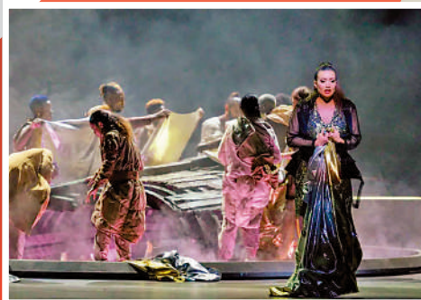
第四屆法國藝術之夏

時間：5月13日-8月31日 地點：天津北寧公園樂觀堂 簡介：聚焦中法當代建築，展示國際知名中法建築師所設計獨具特色的作品，以及彼此的互相呼應。