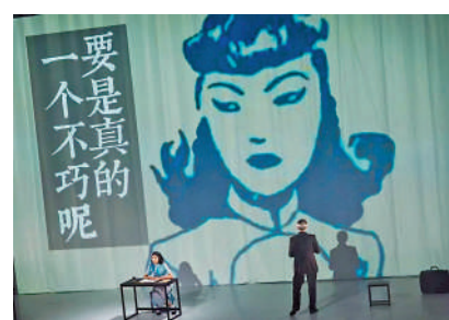
▲燈光舞美兼具科技與美感。

100周年而製作的全新劇目。文本選取了張愛玲的作品及文章，配以獨特的舞台科技與創意，以說、唱文