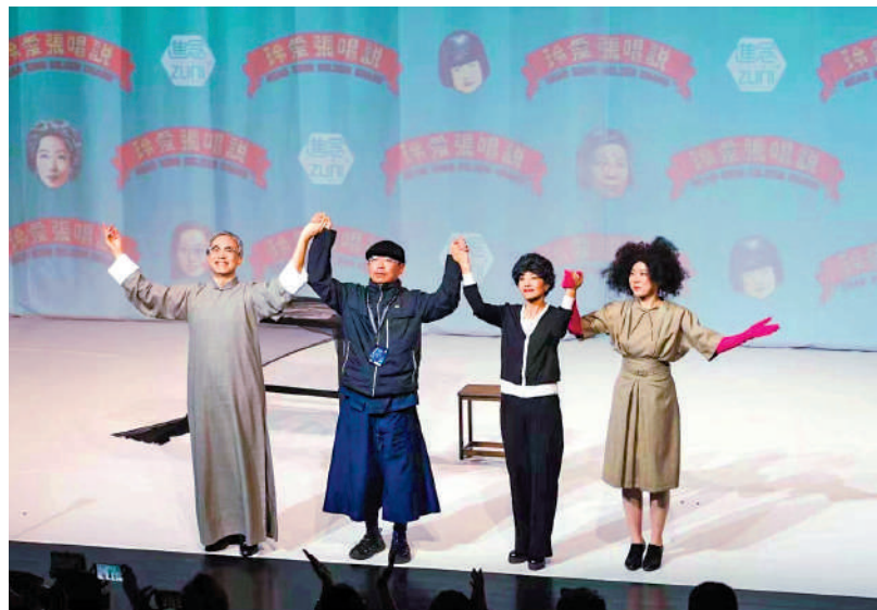
▲《說唱張愛玲》在阿那亞戲劇節首演。