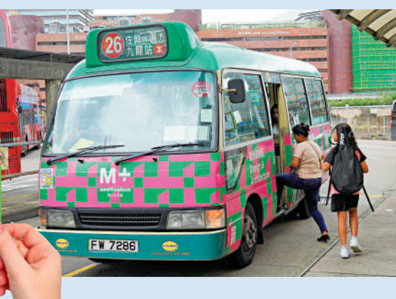
運輸署將成立三人小隊，下周一一起打擊濫用2元乘車，巡查巴士、小巴、渡輪。