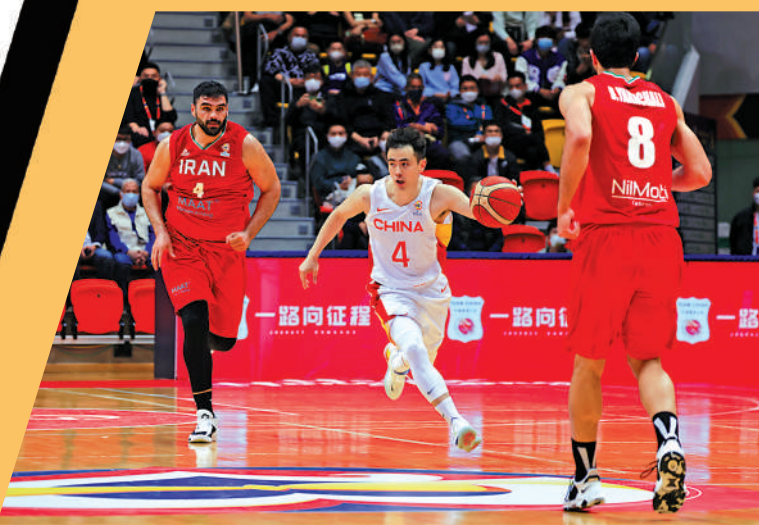
▲中國男籃球員趙繼偉（中）今年初在港出戰世盃資格賽。