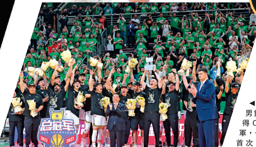
▲本季，遼寧男籃第3次獲得CBA總冠軍，也是他們首次實現衛冕。

「我感觸最深的是賽會制時，酒店裏十幾支球隊，每天彼此都能見面，天天在一起吃飯。就這樣慢慢打到剩最後兩支隊伍，打到沒有人，餐廳也變得空空如也。」