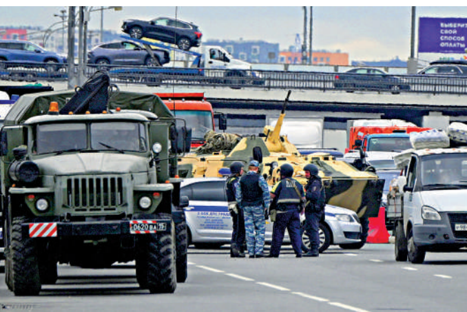
▲24日，一輛裝甲車和俄方警察把守在通往莫斯科的高速公路上。

稍早前，瓦格納通過其Telegram頻道表示，一支瓦格納車隊在沃羅涅日地區遭到襲擊。俄軍發動空襲，使用了炸彈。