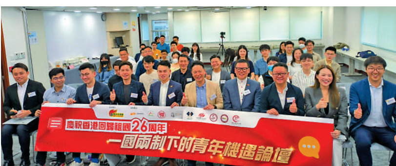
▲青年民建聯昨舉辦「一國兩制下的青年機遇論壇」，多位嘉賓以自身經歷，向青年講解「一國兩制」為香港帶來的機遇。

【大公報訊】記者黃珏強報導：本港不少青年期望投身大灣區建設，青年民建聯昨日舉辦「一國兩制下的青年機遇論壇」，多位嘉賓以自身經歷，向青年講解「一國兩制」為香港帶來的機遇，鼓勵香港青年「走多一步」，主動了解國家大政方針，投身國家發展大局，向世界說好香港故事。