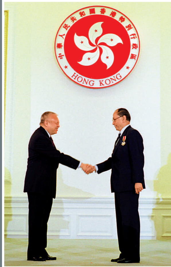
楊鐵樑（右）在一九九九年獲頒發香港特別行政區大紫荊勳章。