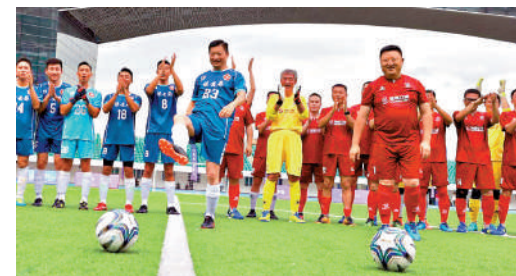
▲鄧炳強着上23號波衫，代表保安局足球隊出戰深圳口岸機關聯隊，進行友誼賽。

頒獎儀式當晚，深圳市副市長張華、香港特別行政區保安局局長鄧炳強等嘉賓為獲獎球員、球隊頒獎。張華認為，本屆賽事是促進深港口岸部門交流合作、深港城市互融相通的成功實踐，更是構建口岸高質量發展