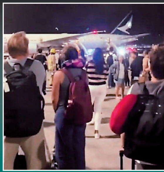
▲大批乘客在停機坪等候機場人員指示離開。