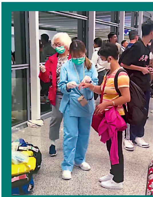
▲工作人員為受輕傷乘客處理傷口。

機場管理局表示，約凌晨0時20分接獲報告，涉事客機返回停機位，隨即打開緊急逃生梯緊急疏散，消防隨即到場支援，救護員即場為受傷旅客治理，局方亦派員到場協助旅客。