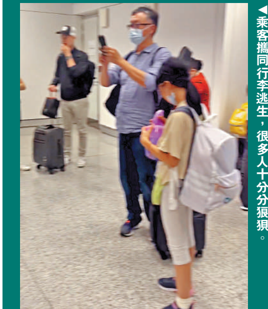
▲乘客攜同行李逃生，很多人十分狼狽。