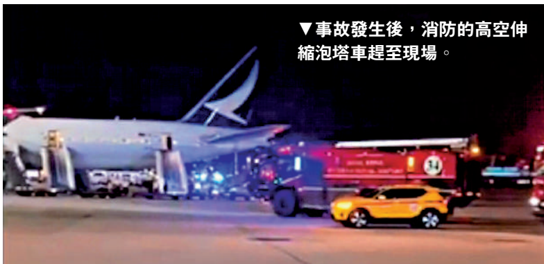
▼事故發生後，消防的高空伸縮泡塔車趕至現場。