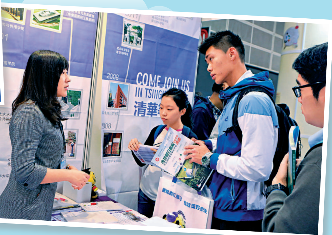
吸引愈來愈多港生報考，為「內地高等教育新華社」。 ▲內地高校水平不斷提高，吸引愈來愈多港生報考，為「內地高等教育新華社」。