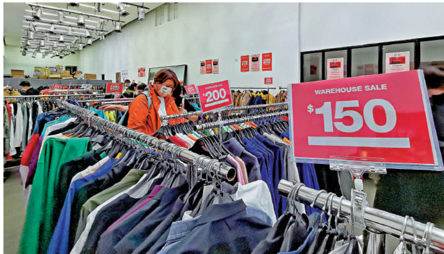
▲港股市況疲弱，除了環政經因素困擾之外，本地因素則為消費力弱，樓市不振。

在講了這麼多不利因素的同時，也要講點有利因素，那就是國家已在積極應對經濟增長緩慢的現象，不斷出台新措施加以扶持，國家領導人頻頻外