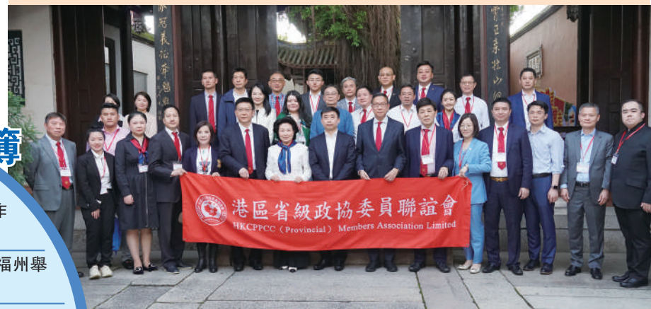
▲2023年4月16日，港區省級政協委員福建浙江經貿文化考察團在福州參觀林則徐紀念館。

福建是重點僑鄉和港澳同胞的主要祖籍地。福建將發揮港澳台僑資源優勢，緊密聯繫各駐境外機構、僑商會、閩籍社團，以情引商、以僑引商、以商引商，構建暢通的國際招商網絡，大力推動閩商回歸工程。