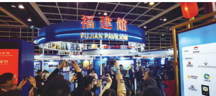
▲2023年3月，「福建館」亮相香港國際影視展，集中中國金雞百花電影節、絲綢之路國際電影節、IM兩岸電影節以及廈門、平潭等省重點影視基地，推介福建影視產業。

值得一提的是，即便是在三年疫情期間，閩港經濟合作交流始終在持續推進，產業合作也在不斷深化。香港貿發局與福建省有關部門共同組織了福建企業赴港上市暨股權投資對接交流活動、閩港企業供應鏈協作出海線上交流會、閩港新機遇座談交流會、廈門市生物醫藥企業香港機遇座談會等系列活動，精準對接企業需求，從政策推動向細化產業項目合作實現深度轉變。