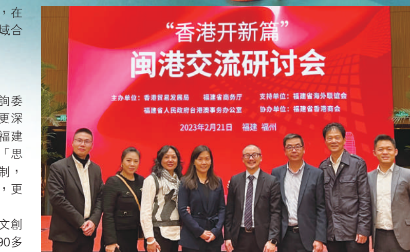
▲2023年2月21日，香港貿發局和福建相關部門在福州舉辦以「閩港合作新機遇」為主題的「香港開新篇」閩港交流研討會。

港）也同期亮相香港時裝節，23家泉州紡織服裝供應鏈企業在此聯合展出，閩港兩地攜手「並船出海」，在暢通開放大通道上兩地尋求更多合作機會。