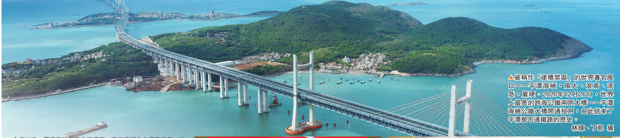
▲被稱作「建橋禁區」的世界著名風口——平潭海峽，風大、浪高、流急、巖硬。2020年12月26日，世界上最長的跨海公鐵兩用大橋——平潭海峽公鐵大橋開通投用，由此結束了平潭島不通鐵路的歷史。

愛國愛港愛鄉是香港閩籍鄉親的傳統，成為香港繁榮穩定的重要支撐。閩港兩地淵源深厚，無論在人文交流，亦或是經貿往來上，歷來保持着良好的合作關係，互補共贏空間很大。長久以來，香港也是福建最大的外資來源地，是福建企業走向國際的「橋頭堡」，是福建企業境外融資的首選地。2015年閩港兩地會議機制建立，兩地高度關注交流合作，迄今閩港合作會議已成功舉行三次會議。近年雖經歷疫情考驗，但閩港合作韌性十足，成果顯著。數據顯示，2022年，迄今閩港合作會議已成功舉辦三次，同比增長3.8%，實際利用港資34.7億美元，佔福建全省同期實際利用外資的69.4%。