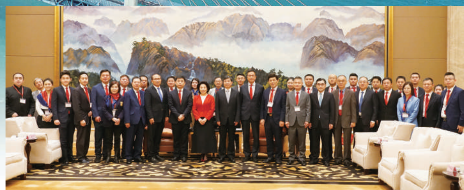
▲2023年4月16日，福建省委書記周祖翼在福州會見了港區省級政協委員福建浙江經貿文化考察團一行。