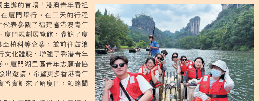
▲2023年5月，香港工聯會福建中心舉辦「2023香港青年發現福建」活動，帶領三十多位在閩港生一起探索武夷山水，體驗武夷茶文化。

為增進香港青年對福建歷史文化的認識和了解，增進閩港兩地交流交往，5月26日—5月28日，由福建省總工會和香港工聯會福建中心主辦的「香港青年發現福建」活動走進武夷山。來自在閩高校就讀的香港大學生一行30人，在武夷山體驗傳統制茶工藝，在建盞基地遇林窠體驗製作建盞，共同領略武夷山的秀美山水和博大精深的中華文化。4月10日—12日，由福建省青聯與香港福建社團聯合會委會、香港「義運班」共同主辦的首場「港澳青年看祖國」福建行主題活動在廈門舉行。在三天的行程中，34名香港青年學生代表參觀了福建省港澳青年（廈門）同心交流基地、廈門規劃展覽館，參訪了廈門大學等高校和美圖、美亞柏科等企業，並前往鼓浪嶼、南普陀寺、曾厝垵進行文化體驗，增強了香港青年的文化認同感和國家認同感。廈門湖里區青年志願者協會的青年代表還向香港青年發出邀請，希望更多香港青年通過城市體驗、交流走訪、實習實訓來了解廈門，領略閩南文化。