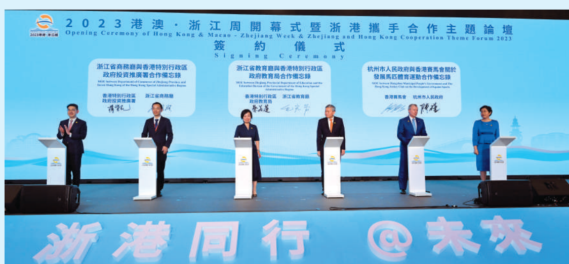
▲在「2023港澳·浙江周」現場，浙港兩地簽署了26個合作項目，涉及高端製造、信息技術、教育科技、商貿物流、金融保險、體育運動等領域。

李家超表示，歡迎浙江企業善用香港作為「走出去」和把外資「引進來」的首選平台。