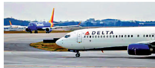
▲ 美國得州一名地勤人員23日被捲入客機引擎中，當場死亡。

外。去年12月31日，亞拉巴馬州蒙哥馬利機場一名地勤人員被飛機引擎吸入而死亡，涉事的皮埃蒙特支線航空公司被美國職業安全與健康管理局罰款1.56萬美元（約12萬港元）。