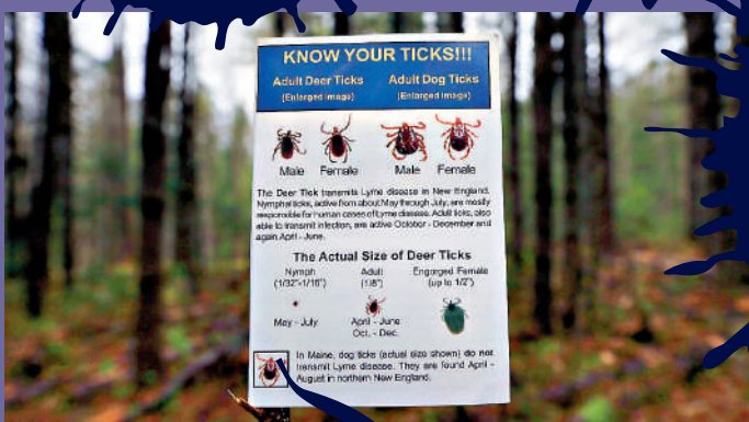
▲ 美國緬因州樹林裏的告示牌，呼籲民眾在4月至9月警惕蜱蟲。

進入草叢、灌木等蜱蟲棲息場所時，須做好防護，穿淺色長袖衣褲；外出回家後立刻把衣服換下來；噴含有避蚊胺的防蚊液，也有驅蟲的效果。另外，如果真的要被硬蜱咬，要盡速用鑷子夾住硬蜱的口器，將其摘除，並立刻用肥皂沖洗叮咬處，降低感染病毒的風險。