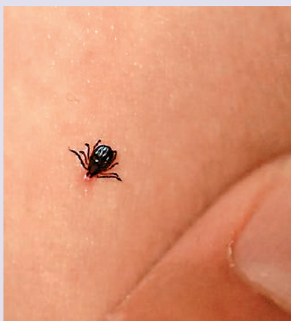
▲ 蜱蟲叮咬人類皮膚後，可傳播Oz病毒等其他疾病。