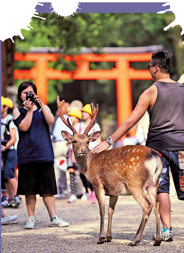
▲ 網友提醒遊客到訪奈良時勿摸鹿群，以防被蜱蟲叮咬。