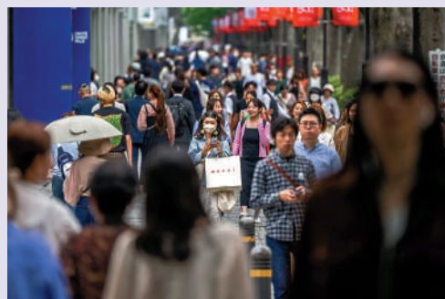
▲ 日本第九波新冠疫情來襲，圖為23日人們走在東京街頭。

感染事件接連發生，專家預計今後可能還會進一步增加。 尾身茂當天與日本首相岸田文雄會面，討論如何應對第九波新冠疫情。 尾身茂表示，日本社會高齡化嚴重，因此保護老年人是應對第九波疫情時最重要的課題。尾身茂強調，雖然不知道第九波感染人數，是否會超過第八波，不過無論如何，政府都應該努力減少死亡人數，讓社會正常運轉。尾身茂指出，需要採取措施減少新冠死亡人數，包括進行第六次疫苗接種，尤其是針對老年人。