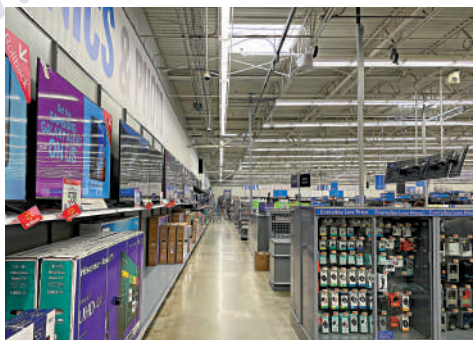
▲ 近日包括沃爾瑪超市在內的多家美國超市收到炸彈威脅。圖為沃爾瑪超市。