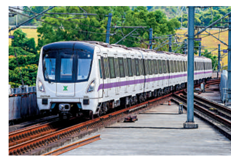
▲深圳已開通運營16條地鐵線路。

五期規劃將發揮交通先行引導作用，促進創新資源要素快速合理流動，支撐城市重點區域、先進製造業園區建設。五期規劃將進一步擴大對重大醫療、文化、教育、體育、保障性住房等公共設施覆蓋，推動全域公共服務一體化均衡發展。軌道交通五期規劃線路2028年全部建成通車後，全市城市軌道交通通車里程將達到831公里，位居全國各大城市第五，將為深圳構建現代化城市綜合交通體系、基礎設施高質量發展試點工作奠定堅實基礎，為市民出行提供更大便利。