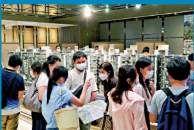
▲在現時市場環境下，本港樓價較平穩，特區政府沒有需要干預樓市。