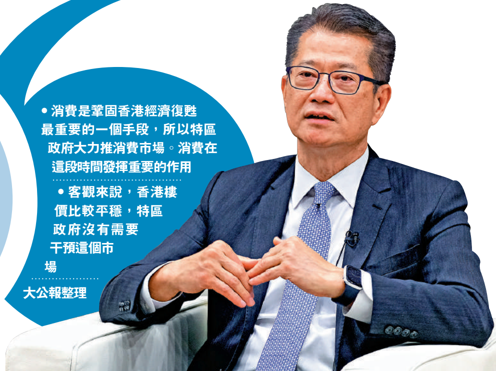
▲陳茂波指，香港經濟要更好的發展，需要有新動能，也要產業多元化，第三代互聯網、綠色金融、綠色科技是未來經濟新動力。