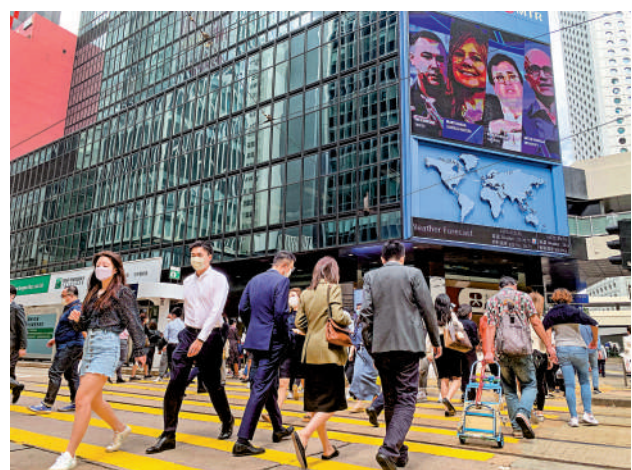
▲陳茂波指，兩地通關後，內地訪港旅客增加，整個投資氣氛轉好。

香港經濟下半年會比較上半年有改善，全球加息步伐趨於穩定，進一步加息空間有限。伴隨着整體經濟氣氛轉好，下半年經濟表現會優於上半年。