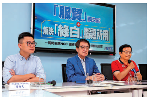
▲國民黨召開記者會，支持兩岸重啟商談服貿、貨貿協議。

朱鳳蓮續指，兩岸服貿協議對服務業佔比很高的台灣來說，對其經濟的促進作用不言而喻，民進黨當局不思悔改，頑固進行政治操弄，繼續污蔑抹黑服貿協議，難怪其相關論調被島內媒體斥為「謬論」。