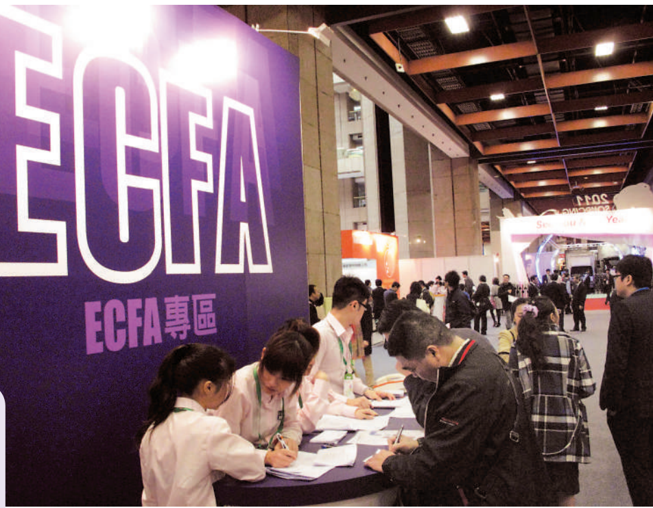
▲ECFA實施十多年來，給台灣經濟帶來了實實在在的好處。