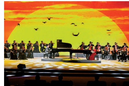
▲海峽論壇是兩岸民間交流盛會。圖為兩岸藝人合作演奏。

7至8月，全國台聯將舉辦以「龍脈傳承 青春中華」為主題的第十二屆台胞青年千人夏令營。7月上旬將在北京舉辦總參訪交流活動。