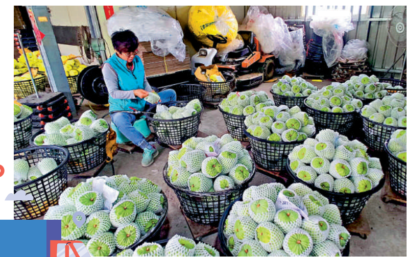
▲大陸最近恢復輸入台灣番荔枝，獲島內農民好評。資料圖片

在回答兩岸直航點復航的問題時，朱鳳蓮說，台胞台商對恢復兩岸往來期盼高、需求旺。兩岸航空公司積極尋求恢復兩岸航線航點航班，但民進黨當局仍在繼續阻撓有關航點復航。大陸航空公司曾多次向台民航主管部門表達恢復武漢、寧波、鄭州等航點的意願並提出申請，均遭拒絕或退件處理。希望台方盡快撤除單方面設置的不合理限制，把兩岸航線航班交給航空公司根據市場自主調節，滿足兩岸民眾出行需要。