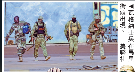
▲瓦格納士兵在馬里街頭出現。

●俄羅斯是委政府最大的債權人之一，自2006年以來向其提供了約170億美元貸款。瓦格納集團在2019年委內瑞拉動亂期間，負責保護委總統馬杜羅，以及協助訓練委國作戰部隊。