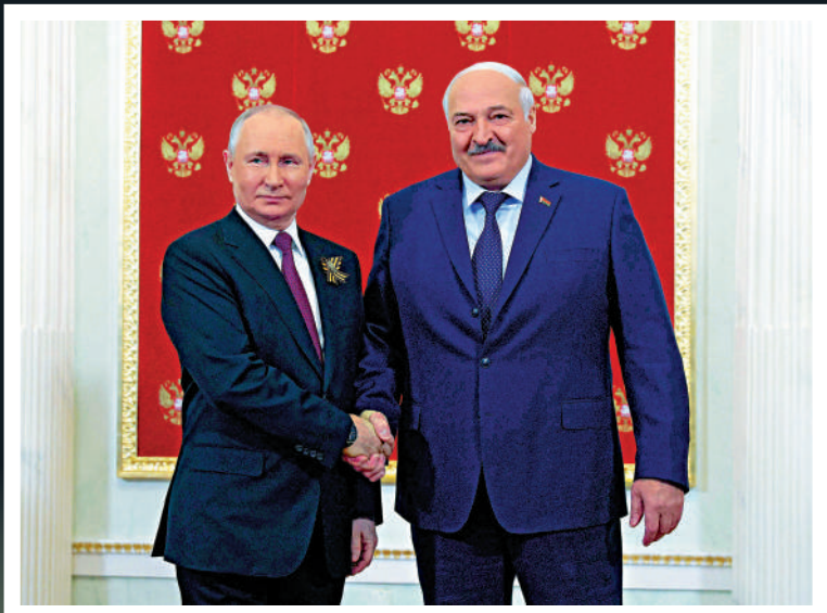
▲白俄羅斯總統盧卡申科(右)和俄羅斯總統普里戈任。

【大公報訊】綜合《紐約時報》、路透社、俄新社報道：俄羅斯僱傭兵集團瓦格納的叛亂在短短一天時間內峰迴路轉，白俄羅斯總統盧卡申科居中斡旋作用引人關注。盧卡申科27日透露，他24日在與俄羅斯總統普里戈任通話時，勸說普里戈任不要「消滅」瓦格納集團首領普里戈任；又表示當天在與普里戈任的電話談判中，兩人一度互爆粗口。盧卡申科當時警告，如果瓦格納繼續向莫斯科挺進，在半路上將「像蟲子一樣被碾碎」。