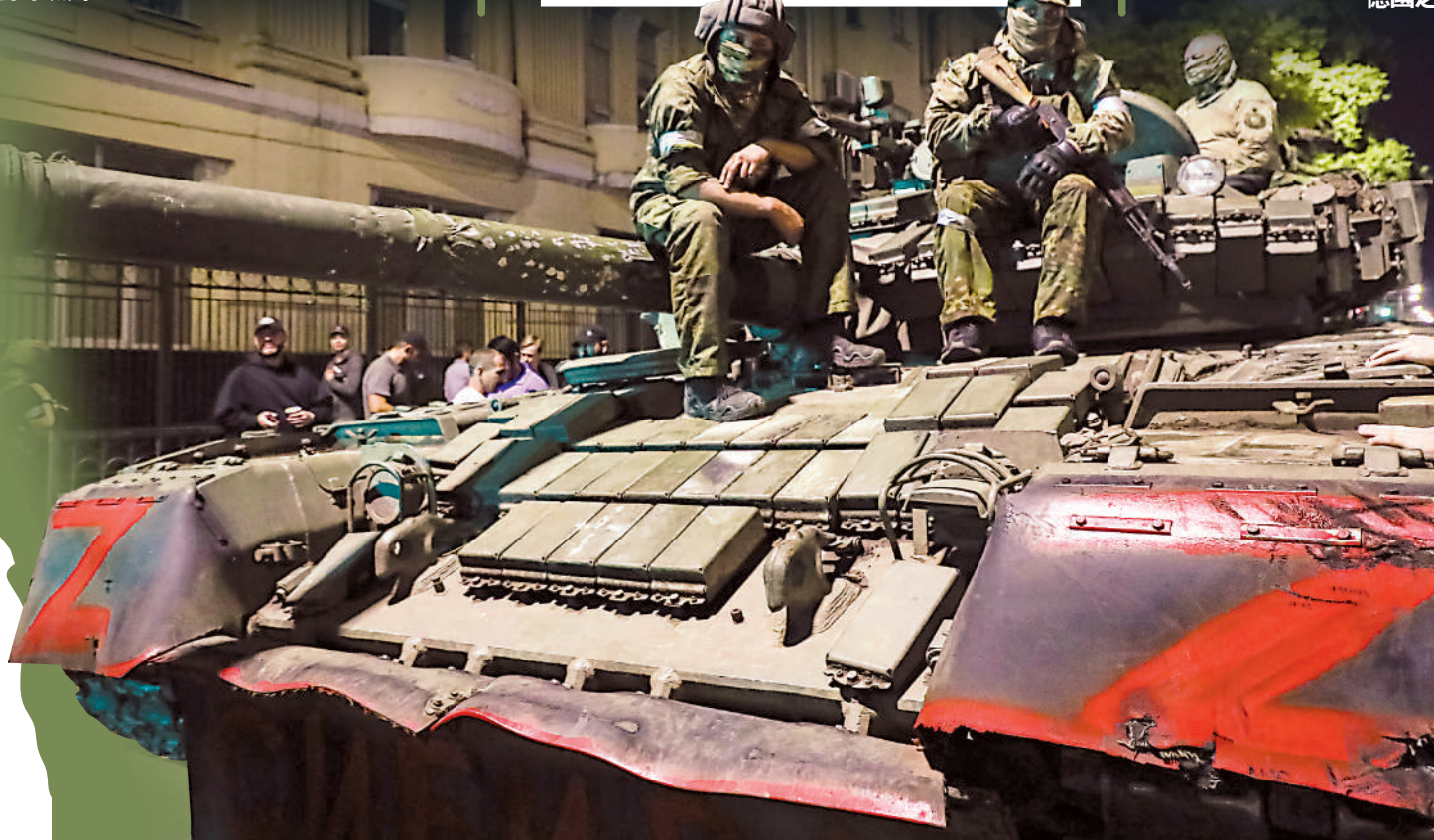
▲24日的兵變中，瓦格納士兵坐在坦克上。