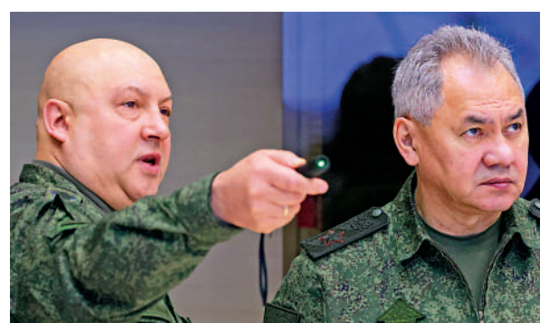
▲蘇羅維金(左)和俄防長紹伊古。

根據攔截到的通訊紀錄，美國官員的結論是，蘇羅維金是軍中強硬派的代表，而普里戈任也經常抱怨俄國防部和軍隊高層未向瓦格納提供足夠武器。幾名官員表示，如果普里戈任認定蘇羅維金只是知道普里戈任的計劃，但沒有給予協助，那麼他或許會不予追究。