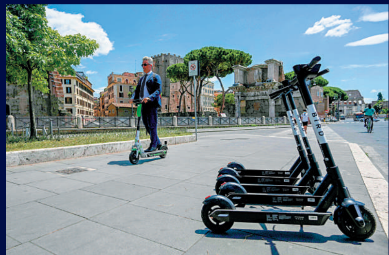
意大利頒布新法，規範民眾使用電動滑板車。