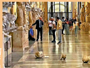
一名美國遊客去年10月在梵蒂岡故意推倒雕像。