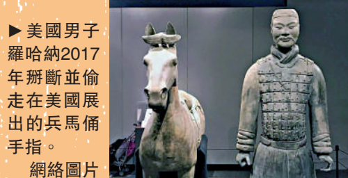
美國男子羅哈納2017年闖入並偷走在美國展出的兵馬俑手指。