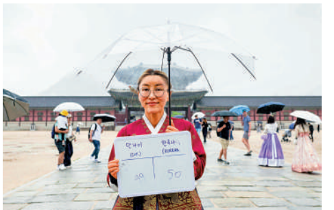
韓國28日起不再用虛歲計算年齡，大部分人都可以「減齡」1到2歲。

【大公報訊】據BBC報道：韓國6月28日正式啟用之前通過的法案，在正式文件上登記年齡時將只使用周歲，不再使用虛歲等另外兩種年齡計算方法。統一年齡