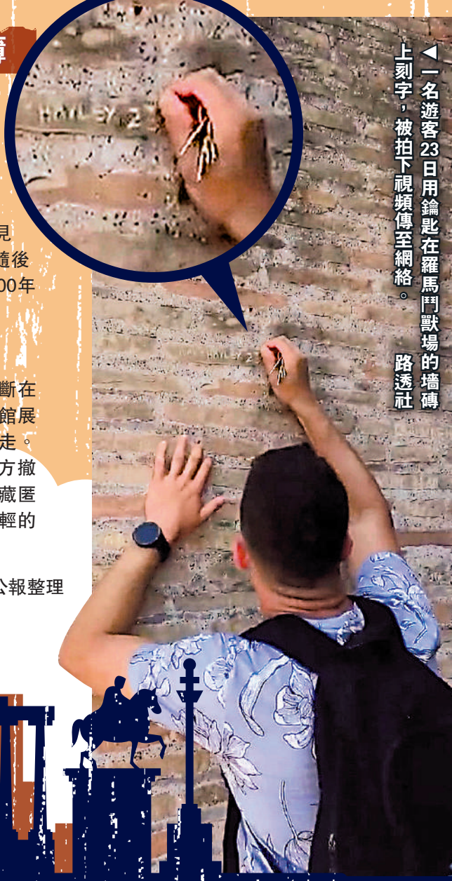
一名遊客23日用鑰匙在羅馬鬥獸場的磚牆上刻字，被拍下視頻傳至網絡。