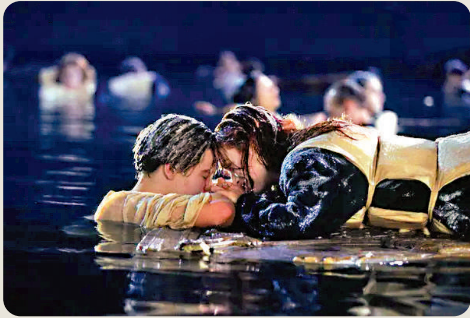
▲一九九七年電影《鐵達尼號》。

除此之外，鐵達尼號沉船地點也和故事本身一樣令人著迷，這種魅力源於人們對乘客故事和沉船周圍獨特環境的好奇，比如導演卡梅隆曾多次前往那裏，認為「萬物被原樣凍結，我們可以觸摸歷史」，其他一些富豪則不惜付出重金甚至生命代價，只為一睹那幽靈般的殘骸。問題是：此次潛水器的失事是會導致鐵達尼號旅遊業的終結，還是會引發新一波興趣熱潮？