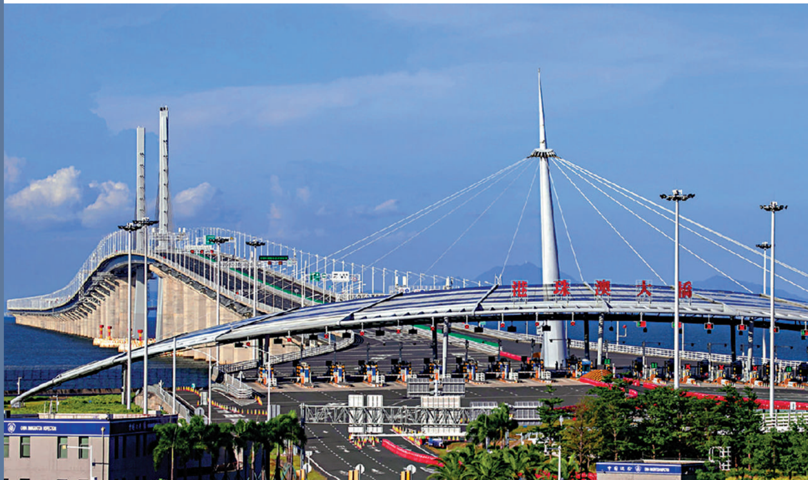
▲「港車北上」7月1日起實施，獲批車輛可經港珠澳大橋口岸往來香港與廣東省。圖為港珠澳大橋。