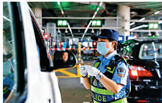
▲隨著大灣區建設穩步推進，粵港澳人員往來更頻繁。圖為珠海邊檢詢問跨境車輛車主信息。