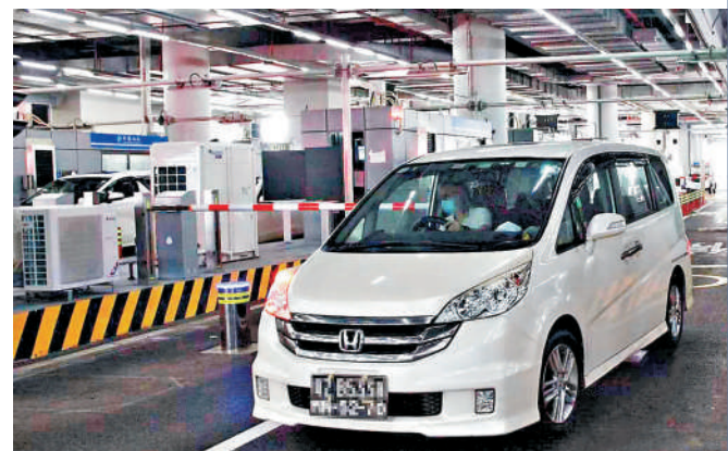
▲「港車北上」助力灣區人車便捷往來。圖為跨境車輛通關。

「港車北上」7月1日起經港珠澳大橋入粵。香港海關署理關長陳子達28日在珠海出席「共建港珠澳大橋經貿新通道大會」時表示，香港海關已完成相關車輛清關系統更新及準備工作，並積極聯同相關部門演練，確保計劃順利推行。港珠澳大橋珠海口岸44條車道已完成10次升級測試，實現「即開即用」。拱北海關所屬港珠澳大橋海關透露，「港車北上」實施後，海關開放車道數量最多可達48條。「港車北上」將使用「一站式」車輛通關系統，驗放時間不超過20秒。