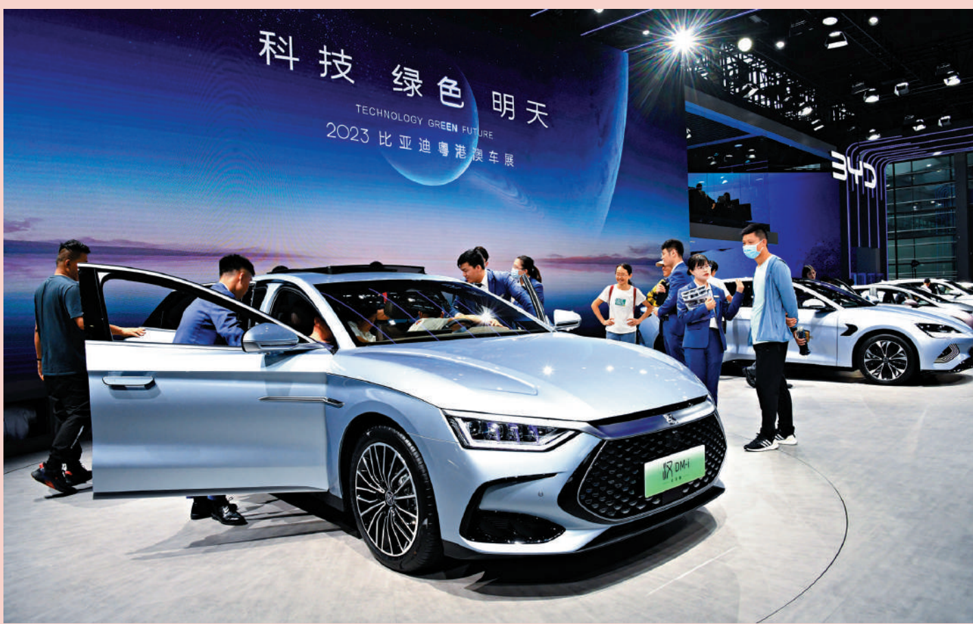
▲6月16日，觀眾在2023粵港澳大灣區車展比亞迪展台了解新能源汽車。