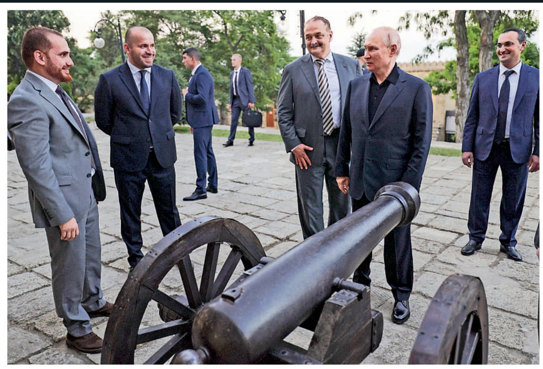
▶28日，普京（右二）參觀傑爾賓特市的納倫卡拉要塞。

瓦格納集團叛亂後，普京28日首度離開莫斯科，視察俄南部達吉斯坦的傑爾賓特市，與達吉斯坦共和國領導人梅利科夫舉行會談。普京在北高加索聯邦管區舉行的旅遊業發展會議上發表了講話。他表示，外國遊客到俄羅斯的所有手續都應輕鬆辦理，包括辦理電子簽證。