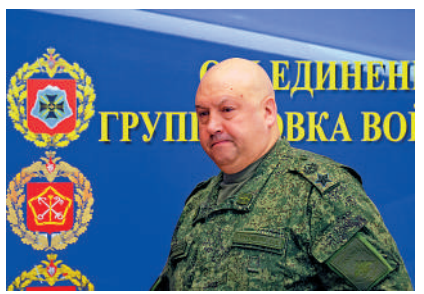
▲蘇羅維金下落成謎。

另外，美國國防部28日宣布，波蘭將採購價值達150億美元的「愛國者」防空系統。同時，波蘭總統杜達說，瓦格納轉移至白俄可能威脅到區域內的國家。