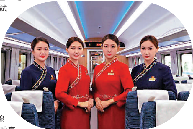
▲以「深藏青」和「喇嘛紅」為主調的西格段「復興號」動車組乘務員新制服。

據國鐵青藏集團有限公司介紹，今年前5月，青藏鐵路西格段累計發送旅客110.11萬人次，同比增長51.62%。其中，西寧、德令哈、格爾木3個車站發送旅客數量最多。西寧直達格爾木方向每日發送旅客1000人次左右。