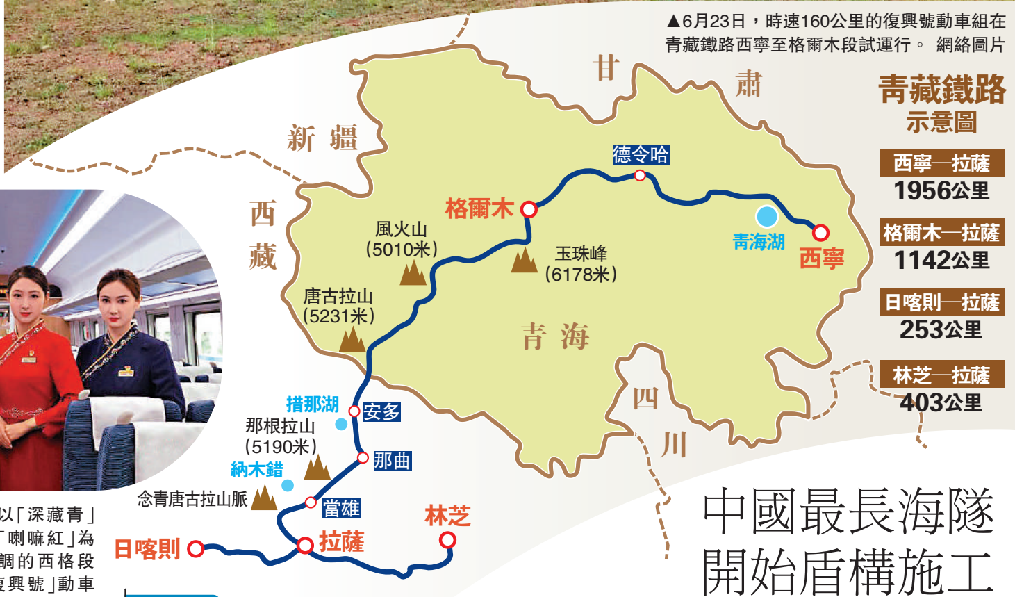
▲以「深藏青」和「喇嘛紅」為主調的西格段「復興號」動車組乘務員新制服。