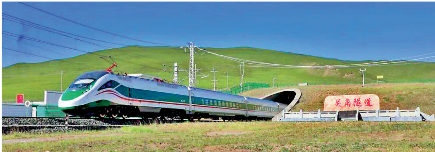
▲6月23日，時速160公里的復興號動車組在青藏鐵路西寧至格爾木段試運行。