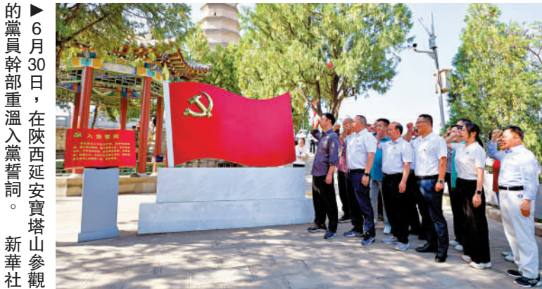
►6月30日，在陝西延安寶塔山參觀的黨員幹部重溫入黨誓詞。

【大公報訊】記者王珏北京報道：中央組織部最新黨內統計數據顯示，截至2022年底，中國共產黨黨員總數為9804.1萬名，比上年淨增132.9萬名。黨的基層組織506.5萬個，比上年淨增12.9萬個。歷經百年風雨和新時代十年革命性鍛造，中國共產黨更加堅強有力、更加充滿活力，黨的組織體系日益嚴密，黨的執政根基不斷鞏固。