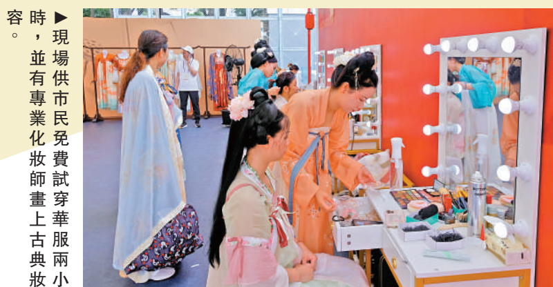
▶現場供市民免費試穿華服兩小時，並有專業化妝師畫上古典妝容。

由香港各界慶典委員會主辦的維園慶回歸活動，昨天舉行首日，吸引大批市民入場參觀體驗。陝西省西安市、遼寧省及山東省代表，以及多家粵港澳大灣區的創科企業，應主辦單位邀請來港參與，活動會場主要分為三省展區、創新科技展區，以及特色打卡熱點區域，展示中華文化的博大精深。