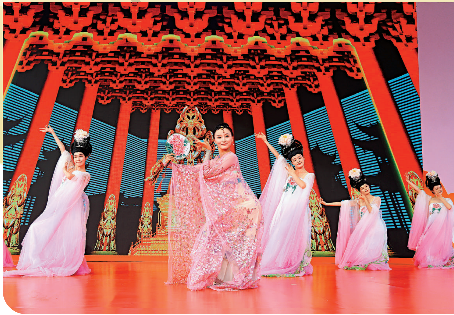
▲維園西安展區的漢服舞蹈表演，吸引大批市民觀賞。