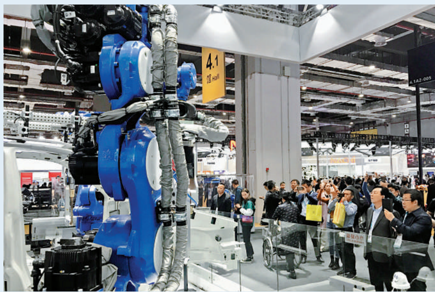
▲6月被調查的21個製造業行業中，有12個行業景氣度按月上升。

中國製造業景氣水平總體有所改善。國家統計局數據顯示，6月中國製造業採購經理指數（PMI）報49，較前值提升0.2個百分點，終結了此前連續3個月的降勢。國家統計局服務業調查中心高級統計師趙慶河表示，6月被調查的21個製造業行業中，有12個行業景氣度上升，數量較5月增加4個，預示經濟保持恢復發展態勢。分析指出，中國經濟恢復勢頭在經歷4月、5月的放緩後，已進入「趨穩運行」狀態，第三季度中後期製造業PMI有望重新擴張。