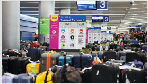
▲美國近期航班延誤嚴重，圖為6月29日加州洛杉磯國際機場大批行李等待認領。

6月29日下午，由於一場雷暴逼近美國最繁忙的樞紐之一的芝加哥奧黑爾機場，FAA要求該機場的航班延遲起飛。美聯航是受影響最大的航空公司，15%的航班被取消，超