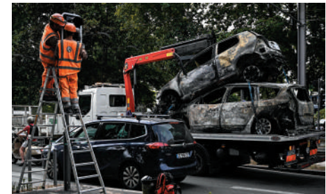
▲6月30日，法國西南部波爾多市，維修人員在被燒毀的汽車旁修理交通燈。

6月27日，法國一名17歲非裔青少年奈爾因駕車時疑似拒絕警察臨檢，遭警員射殺，引發法國全國連續3晚出現暴