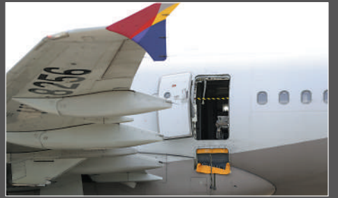
▲5月26日，韓國韓亞航空的飛機逃生艙門被乘客突然打開，致12名乘客輕傷。

6月29日 泰國曼谷機場一名女乘客在使用自動人行道時，左小腿被捲入機器內，須當場截肢，乘客被送往醫院治療。