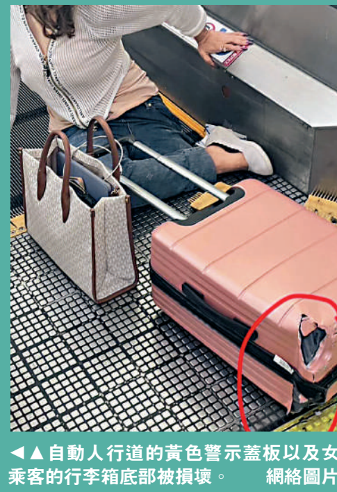
▲自動人行道的黃色警示蓋板以及女乘客的行李箱底部被損壞。

事發於當地時間6月29日上午8時27分，在泰國曼谷廊曼機場2號客運大樓內的4號和5號登機口之間的南走廊上。這名57歲的女乘客計劃乘搭國內航班從曼谷前往洛坤府，她在使用自動人行道時不慎被行李絆倒，左腿膝蓋以下部位被自動人行道卡住，捲入機器中。機場指出，醫療團隊到場評估後，最終不得不現場將她左腿膝蓋以下部位截肢。