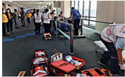
▲醫療團隊6月29日趕往泰國曼谷廊曼機場，該女乘客當場截肢。

這不是廊曼機場的自動人行道第一次發生意外了，2019年，一名男子在Facebook上分享了自己的經歷說，他的鞋子被捲入自動人行道，他當時立馬脫掉鞋子，所幸人沒有受傷。而這名男子只收到了一條機場的道歉短訊，而這條「故障自動人行道」在一個小時之後就重新運行。