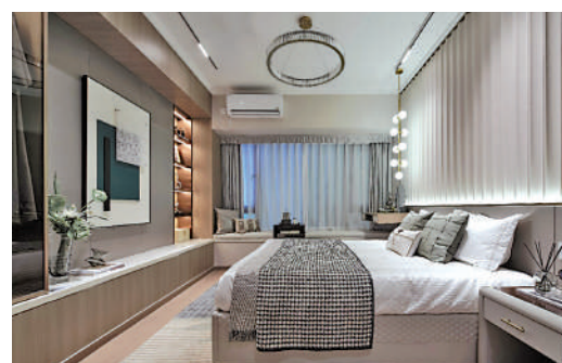
▲新城翡麗雲境單位面積寬敞，間隔實用。

戶型方面，項目主推單位有76平米三房兩廳、87平米三房兩廳、98平米四房兩廳、110平米四房兩廳。單位南北通透，三開間朝南格局，平衡採光通風與保溫兩者間的需要；寬闊露台讓樓下園林美景盡收眼底。另外，主人套房採用180度環幕窗台，光線充足，清風與陽光洋溢滿室。值得一提的是，各款戶型預留百變空間，可隨心改造成睡房、書房、電競室、影音室等，也為年輕家庭將來的添丁做好準備。