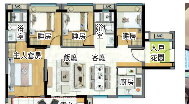
▲保利瓏玥公館102平米四房兩廳戶型圖。