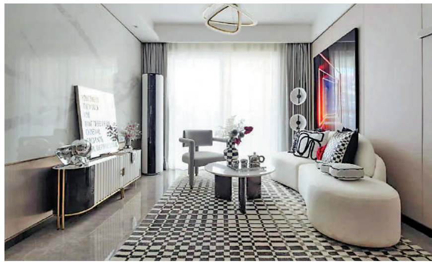
▲新城翡麗雲境目前主推單位面積由76至110平方米，間隔介乎三房至四房。

位於廣州白雲區北部的鍾落潭板塊，近兩年逐漸成為廣州樓市的供應重鎮，目前已吸引保利集團、珠江實業、越秀地產、旭輝控股、綠地集團、新城控股等發展商進駐，區內新盤主打中小戶型，實用率高，受剛需客群追捧。其中，位處廣州北核心區域的新城翡麗雲境，周邊的商業、教育、醫療、生態等配套基本齊全，參考均價每平米約1.9萬元人民幣（約2.05萬港元），在廣州樓市具有競爭力。