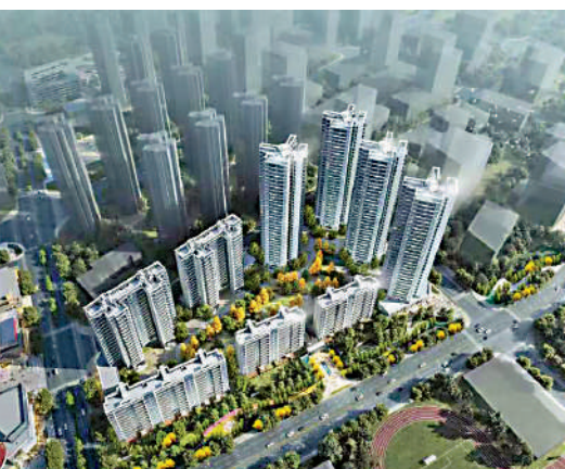
▶越秀·白雲·星匯城以圍合式布局，景觀有保證。