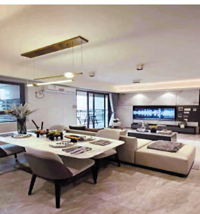
▲保利瓏玥公館以健康為主題，着重單位的採光和通風。