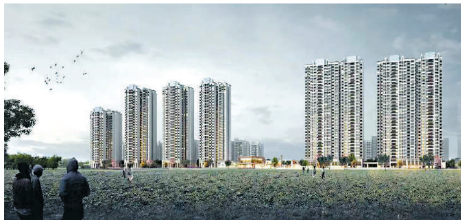
▲保利瓏玥公館由13幢住宅組成，綠化率高。

環保主題 廣州國際健康產業城位於白雲區鍾落潭鎮，目前已有何濟公、明興製藥、和黃中藥等29家醫藥龍頭企業進駐，預計年產值300億元（人民幣，下同）。保利瓏玥公館位於這個升值潛力大的健康產業城板塊，每平米均價2萬元，相對5個地鐵站距離的嘉禾望崗新盤成交價已超過每平米7萬元，性價比高，受剛需上班族追捧。