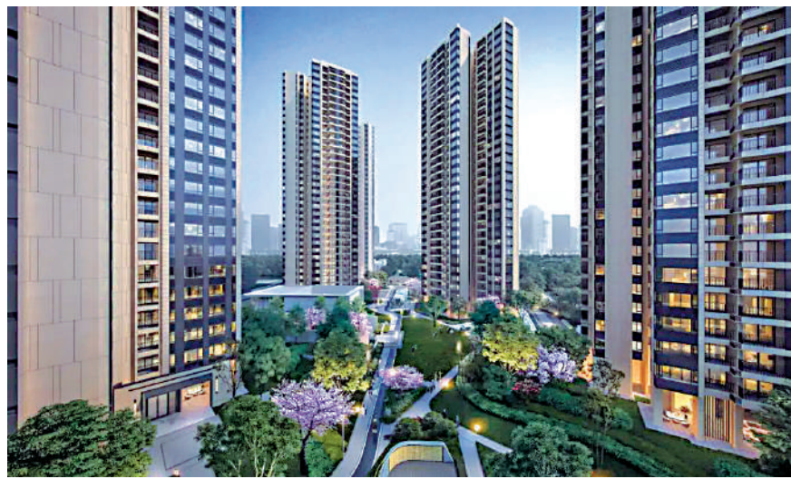
▲新城翡麗雲境總建築面積18.7萬平方米，由高層住宅及疊加別墅組成。

位於廣州白雲區北部的鍾落潭板塊，近兩年逐漸成為廣州樓市的供應重鎮，目前已吸引保利集團、珠江實業、越秀地產、旭輝控股、綠地集團、新城控股等發展商進駐，區內新盤主打中小戶型，實用率高，受剛需客群追捧。其中，位處廣州北核心區域的新城翡麗雲境，周邊的商業、教育、醫療、生態等配套基本齊全，參考均價每平米約1.9萬元人民幣（約2.05萬港元），在廣州樓市具有競爭力。