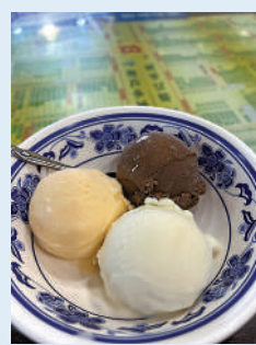
順記冰室出品的三色雪糕。

捧着肚子離開上下九，可以騎自行車到深藏在居民區裏的西華路，那裏是荔灣區另一片「美食天地」，同樣小吃店林立，還有老闆要先看舌頭再對症下藥的老式涼茶舖，很適合體驗老廣生活；也可以騎車到珠江邊上，逛俗稱大鐘樓的粵海關舊址，經過曾是華南最亮麗百貨商店的南方大廈，最後抵達被稱為露天建築「博物館」的歐陸風情沙面島，尋找不一樣的體驗。