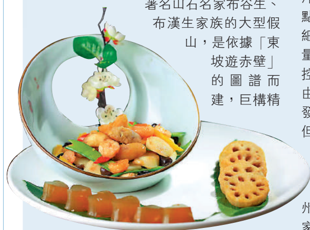
洋溪酒家出品，包含了馬蹄糕的洋塘五秀。受訪者供圖

如今的洋溪酒家坐落在荔灣湖畔，內部布局迂迴曲折，層次豐富，如出自廣東著名山石名家布谷生、布漢生家族的大型假山，是依據「東坡遊赤壁」的圖譜而建，巨構精