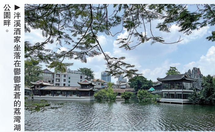
洋溪酒家坐落在鬱鬱蒼蒼的荔灣湖公園畔。