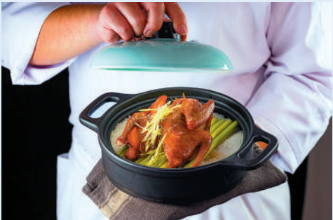
白天鵝賓館出品的香茅乳鴿。