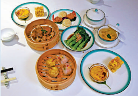
白天鵝賓館出品的各式點心。