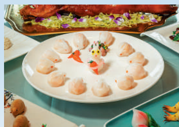
洋溪酒家的綠茵白兔餃。

廣州早茶，可以追溯到清朝咸豐同治年間，是「食在廣州」其中一張亮麗名片。從最初的「二厘館」到茶居再到現代化茶樓，「請早茶」成為一種普遍的社交方式。今年4月，香港特別行政區行政長官李家超率領逾百人的香港特區政府及立法會大灣區訪問團前往粵港澳大灣區內地城市時，就在廣州打卡了洋溪酒家，還發微博說是「水滾茶靚，一盅兩件。」