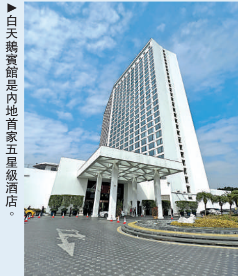
白天鵝賓館是內地首家五星級酒店。

夜色漸深，正是深夜食堂開始活躍的時候。沿江邊，橋底下，城中村的巷子裏，燒烤、炒河粉、沙鍋粥等宵夜美食逐漸閃亮登場。今天，又是美好的一天！