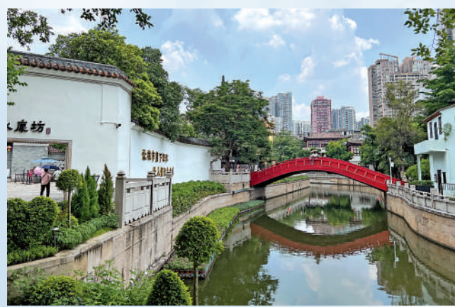
西關永慶坊旅遊區荔枝灣涌沿岸景色。