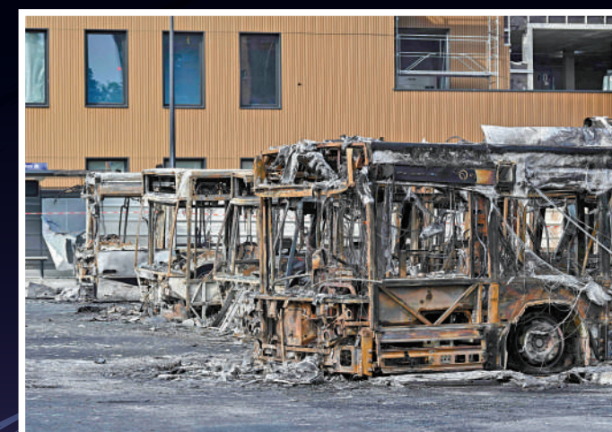
▲6月30日，巴黎北部奧貝維利耶的公車被燒毀。