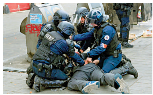
▲6月30日，法國警察逮捕一名示威者。