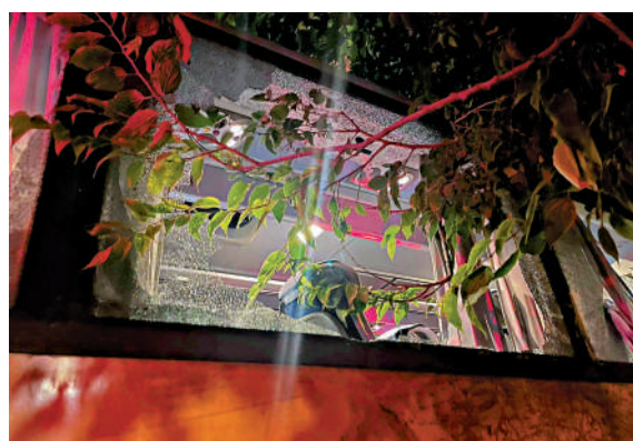
▲載有中國遊客的旅遊巴士側面的玻璃窗被砸碎。網絡圖片