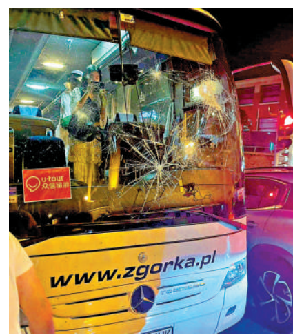
▲涉事旅遊巴士被砸破擋風玻璃。