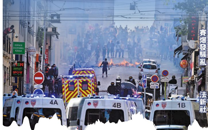
▲6月30日，法國南部馬賽爆發騷亂。