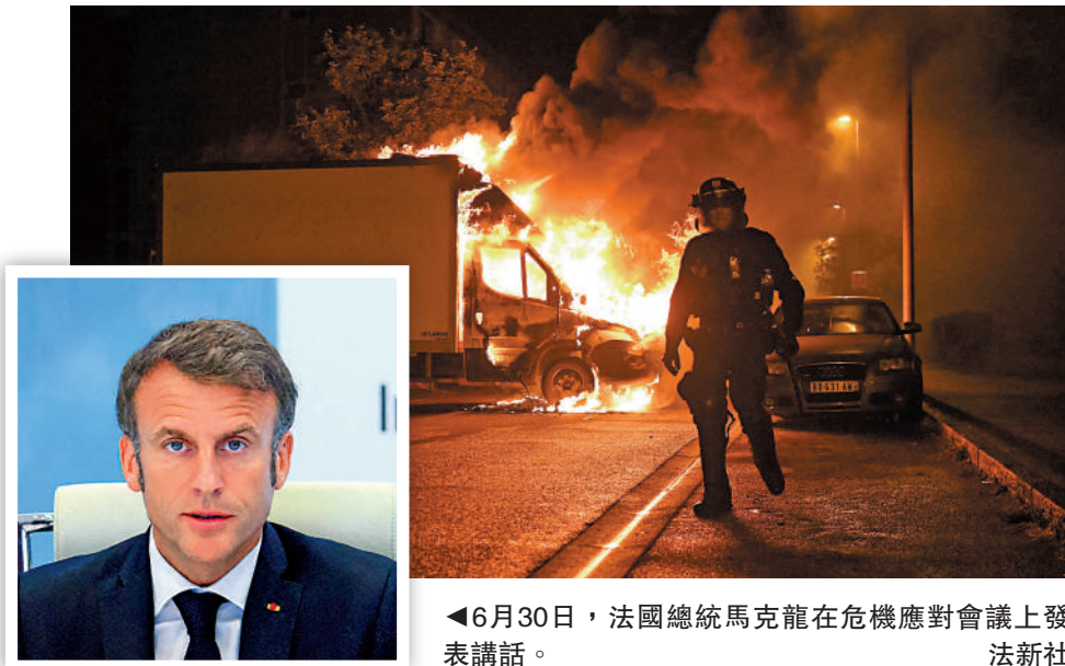
▲6月30日，法國總統馬克龍在危機應對會議上發表講話。法新社

【大公報訊】綜合法新社、《衛報》報道：法國17歲少年之死引發的全國騷亂持續四晚，當局於6月30日晚在全國部署了4.5萬名警力維持治安，但暴力騷亂仍持續蔓延，第二大城市馬賽騷亂最為嚴重，警方當晚逮捕了逾一千人，目前被捕人數已經超過2300人，隨時進入緊急狀態。因應國內局勢，總統馬克龍宣布取消7月2日赴德國的國事訪問。另外，法國正迎來暑期旅遊旺季，然而暴力騷亂衝擊當地旅遊業，商家叫苦不迭。