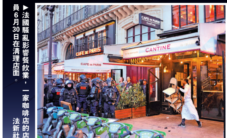
▲法國騷亂影響餐飲業，一家咖啡店的店員6月30日在清理店面。