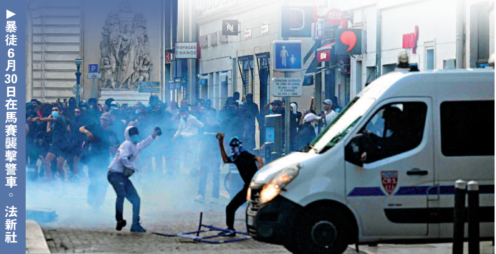
暴徒6月30日在馬賽襲擊警車。法新社

威」，而報道法國此次事件時卻全部使用了「騷亂」(riot)甚至「暴力騷亂」的字眼。一名網友在社交媒體上嘲諷說：「你們怎麼不像2019年時那樣，稱讚街上的人是『自由鬥士』或『民主戰士』？」另一名網友調侃說，如果馬克龍是一個非洲國家的領導人，西方國家現在應當已經為他貼上了「獨裁者」的標籤，並資助一個武裝組織推翻他的政權。