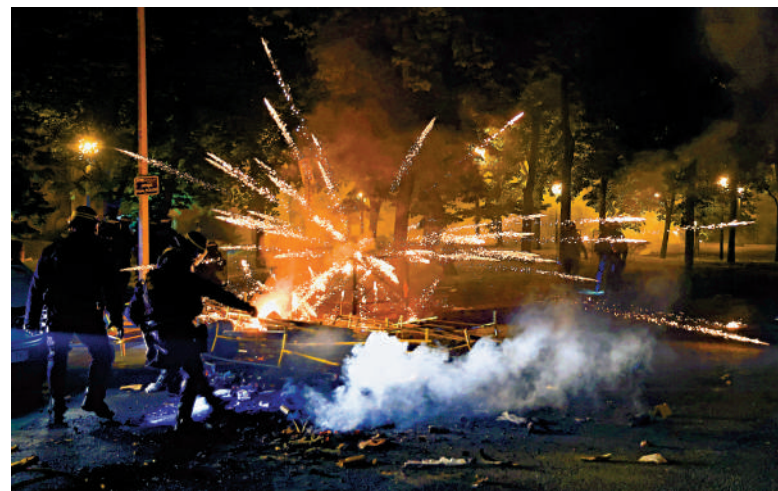
警方6月30日在楠泰爾與暴徒對峙。

美國之音稱，大規模警察部署受到被襲擊社區的居民和遭劫掠商店的店主歡迎。法國總統馬克龍和多位部長均表示將堅決打擊暴徒和煽動者。法國經濟、財政及工業、數字主權部長勒梅爾1日說，騷亂已導致數百家超市、煙草專賣店、儲蓄所、快餐店等蒙受損失，並要求保險公司迅速對受損失商戶進行理賠。