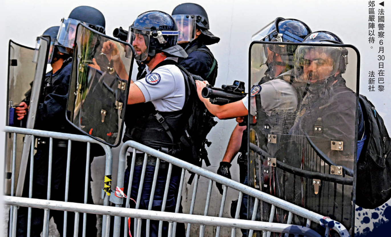
法國警察6月30日在巴黎郊區嚴陣以待。

【大公報訊】綜合法國國際廣播電台、美聯社、BBC報道：法國17歲少數族裔少年之死引發的騷亂持續多天，當局出動包括特種部隊在內的4.5萬名警察和憲兵平亂。截至7月2日共逮捕約2800名暴徒。法國總理博內爾周日強調，不能夠讓暴力不獲懲處，對作惡者必須實施最嚴厲的處罰。據悉，大量未成年人參與製造騷亂，被捕者平均年齡僅為17歲，最小的年齡只有13歲。法國總統馬克龍嚴肅要求家長管好孩子，司法部長莫雷蒂2日更警告說，未盡到監護責任的家長或將面臨兩年監禁和3萬歐元罰款的嚴厲懲罰。