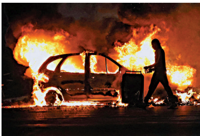
6月30日，一名暴徒在波爾街頭縱火燒毀一輛汽車。