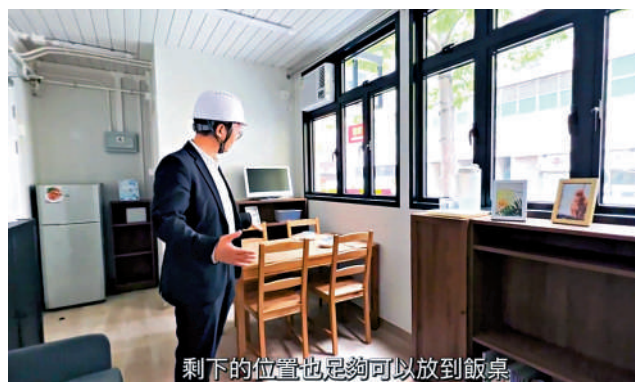
▲「仁愛居」採用「橫向型」，令單位更光猛和通風。