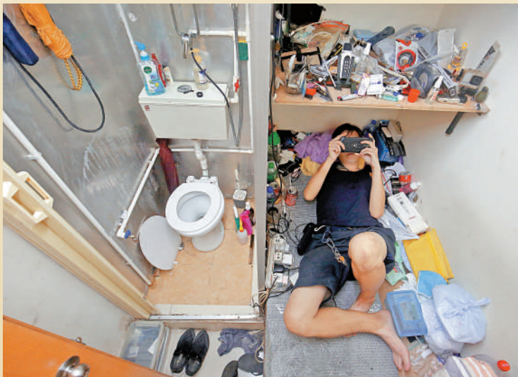
▲劃房戶生活環境惡劣，盼望能早日上樓。