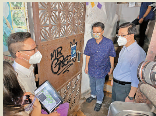
▲李家超出任特首以來一直重視房屋問題，經常探訪劃房戶了解情況。

社區組織協會副主任施麗珊向大公報記者表示，今屆政府在房屋方面提出多項大的政策，包括興建3萬個簡約公屋，以及在考慮如何提速。她稱粉嶺高球場出現太多爭議，導致一直未能興建公屋，希望政府看到劃房居民的難處，加快速度爭取落實建屋計劃。