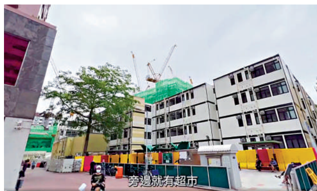
▲洪水橋的過渡房屋「仁愛居」本月中開始入伙。