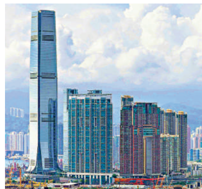
▲家族辦公室對超級豪宅的投資興趣濃厚。