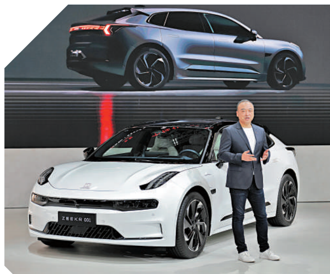
▲吉利汽車旗下「極氪」上月交付量破萬輛。