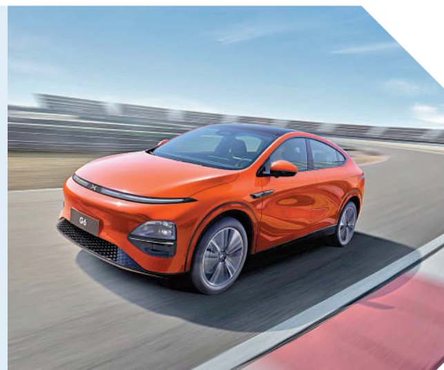
▲小鵬「G6超智駕轎跑SUV」訂單理想。